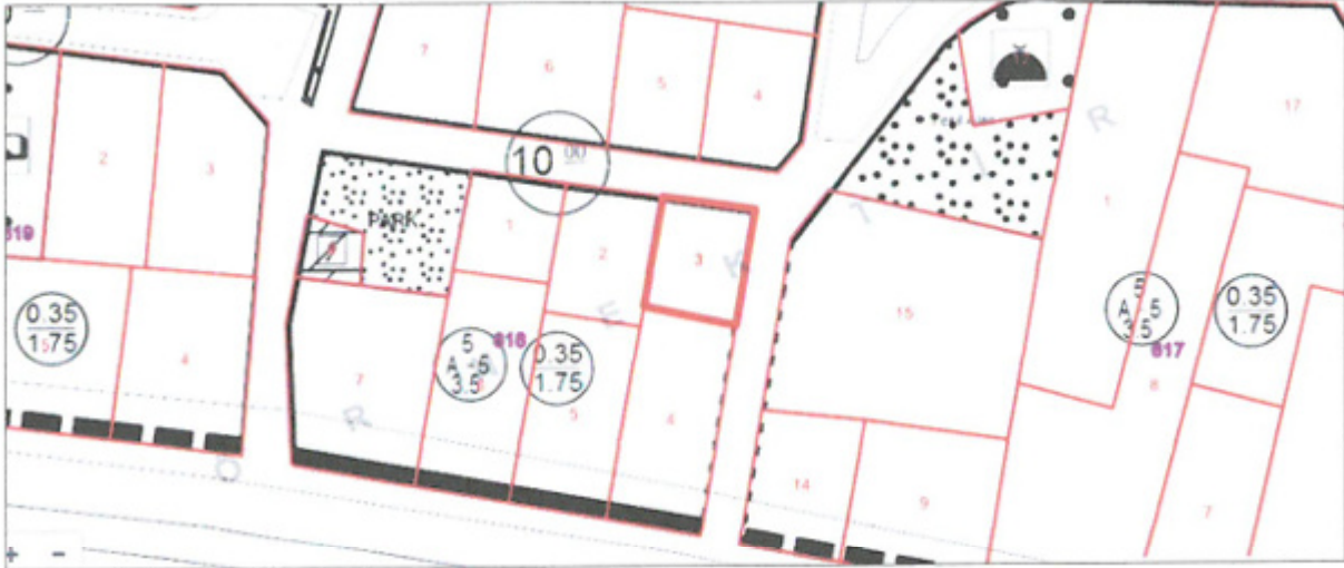
Şekil 3. Onaylı Uygulama İmar Planı

Plan değişikliğine konu parcel Alanya İlçesi Kellerpınarı Mahallesi 618 ada 3 parcelin tamamını kapsamaktadır. Plan değişikliğine konu alan mevcut imar planlarında konut alanı olarak planlanmıştır. Onaylı uygulama imar planında TAKS (taban alanı katsayısı) 0.35, KAKS (kat alanı katsayısı) 1.75'dir ve parcel ayırık nizam 5 kat, yollardan çekme 5 metre komşu parsellerden ise 3.5 metre olarak belirlenmiştir.