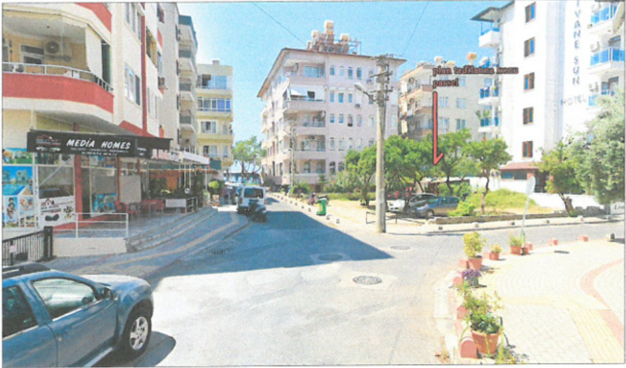
Şekil 6. 618 Ada 3 Numaralı Parsel Ve Çevresi

Plan tadilatına konu parsel 334 m 2 'dir. Onaylı plana göre parselde oluşan taban alanı büyüklüğü 116.94 m 2 'dir ancak parselde çekmelerden sonra yapılabilecek taban alanı büyüklüğü ise 93.7 m 2 'dir. Onaylı plana göre parselde yapılabilecek toplam inşaat alanı emsal ve emsal harici alanlar (%30) 759.85m 2 'dir. Onaylı plandaki çekmelere uygun olarak parselde yapılabilecek toplam inşaat alanı 642.5m 2 'dir. Plan ve plan notları ile belirlenen çekme mesafelerine göre yapı yapılması durumunda parselde tanımlanan yapılaşma hakkının 117.35 m 2 'sini kullanamamaktadır. Yapılan plan tadilatı ile söz konusu kaybın azaltılması ve parselde tanımlanan yapılaşma hakkının kullanılabilmesi amaçlanmaktadır.