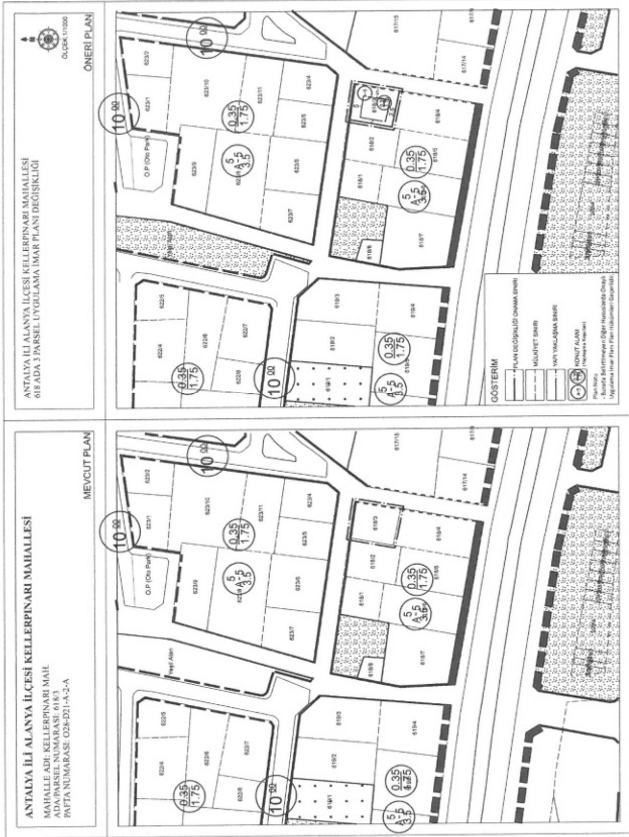
Şekil 7. Mevcut ve Öneri 1/1000 Uygulama İmar Planı Örnekleri