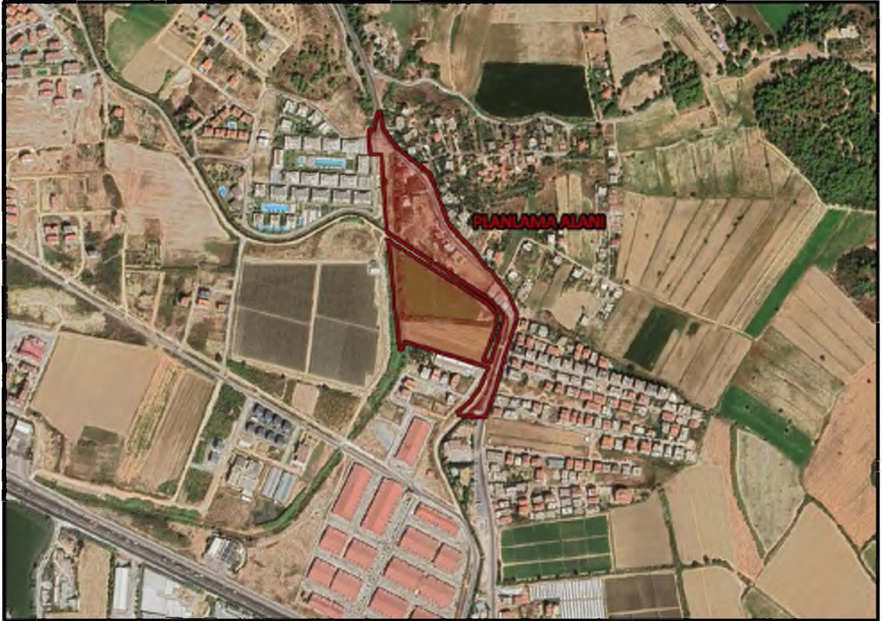
Şekil 1: Planlamaya Konu Alanın Uydu Görüntüsü

Söz konusu alanın yakın çevresinde, konut alanları, küçük sanayi alanları ve boş alanlar bulunmaktadır.