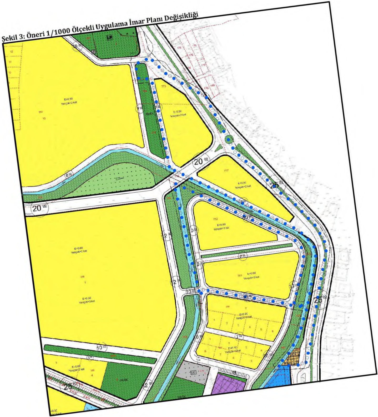
Sekil 3: Öneri 1/1000 Ölçekli Uygulama İmar Planı Değişikliği