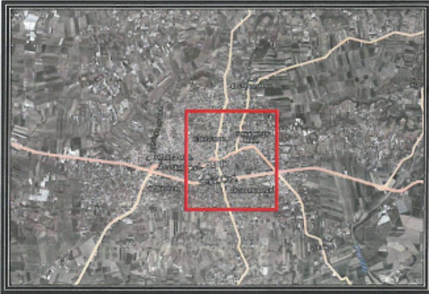
2. Planlama Alanı Uydu Görüntüsü