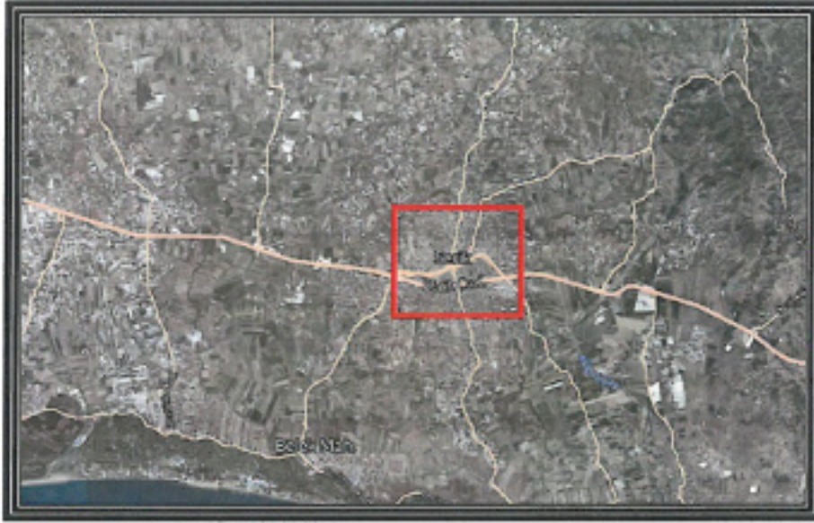
1. Genel Uydu Görüntüsü

Antalya İli, Serik İlçesi, Merkez bölgesi yürürlükteki 1/1000 ölçekli Uygulama İmar Planı Plan Notlarında ilave yapılmak istenmektedir.