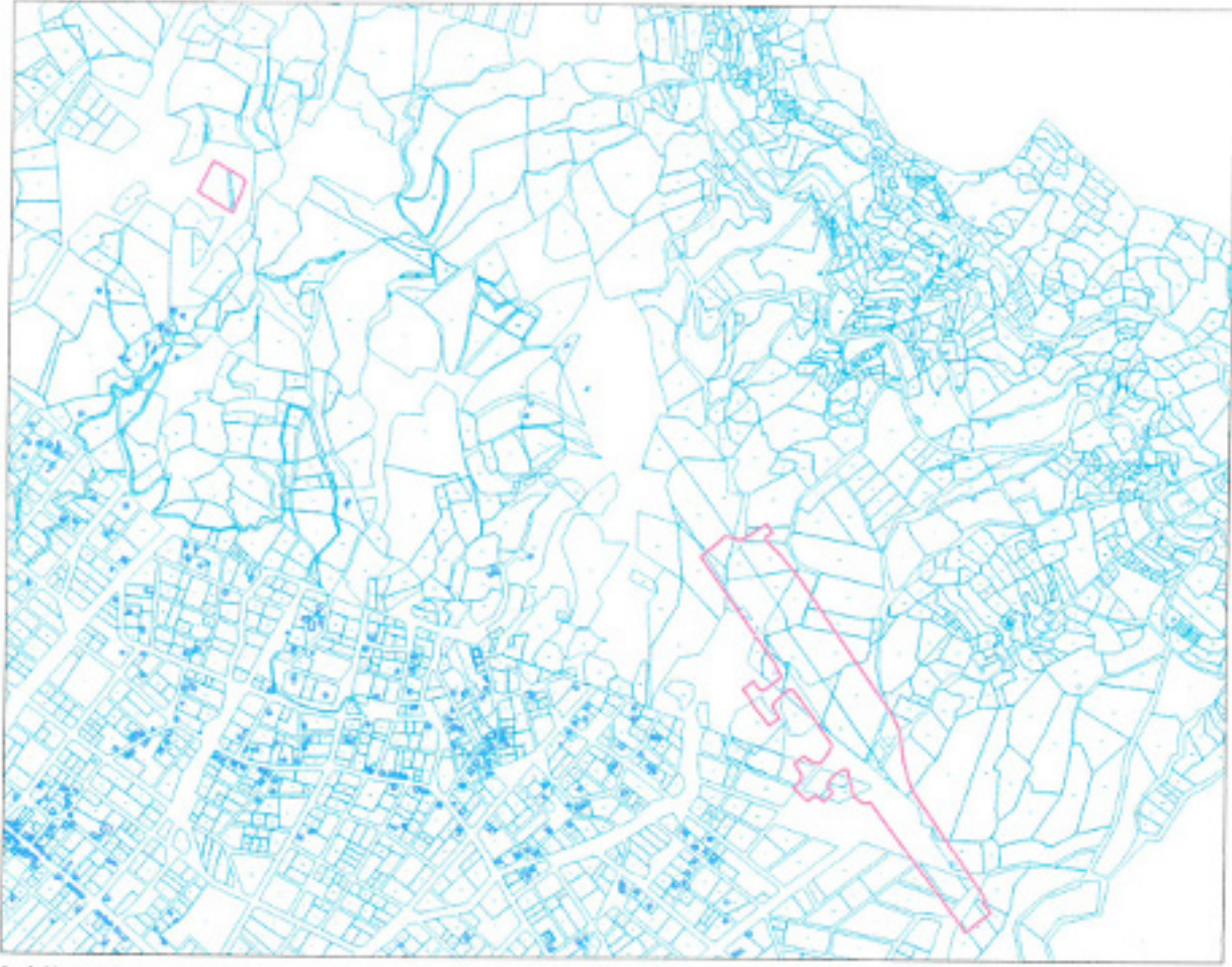
Şekil 6. Kadastral Durum