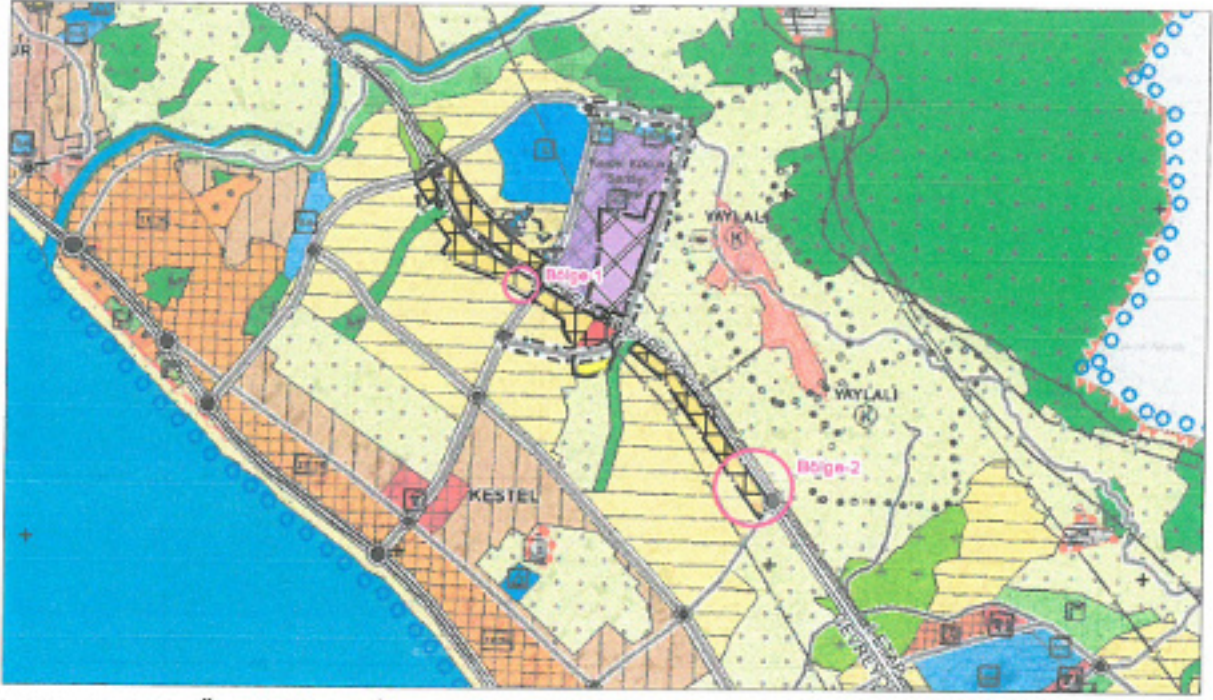
Şekil 5.1/25.000 Ölçekli Nazım İmar Planı