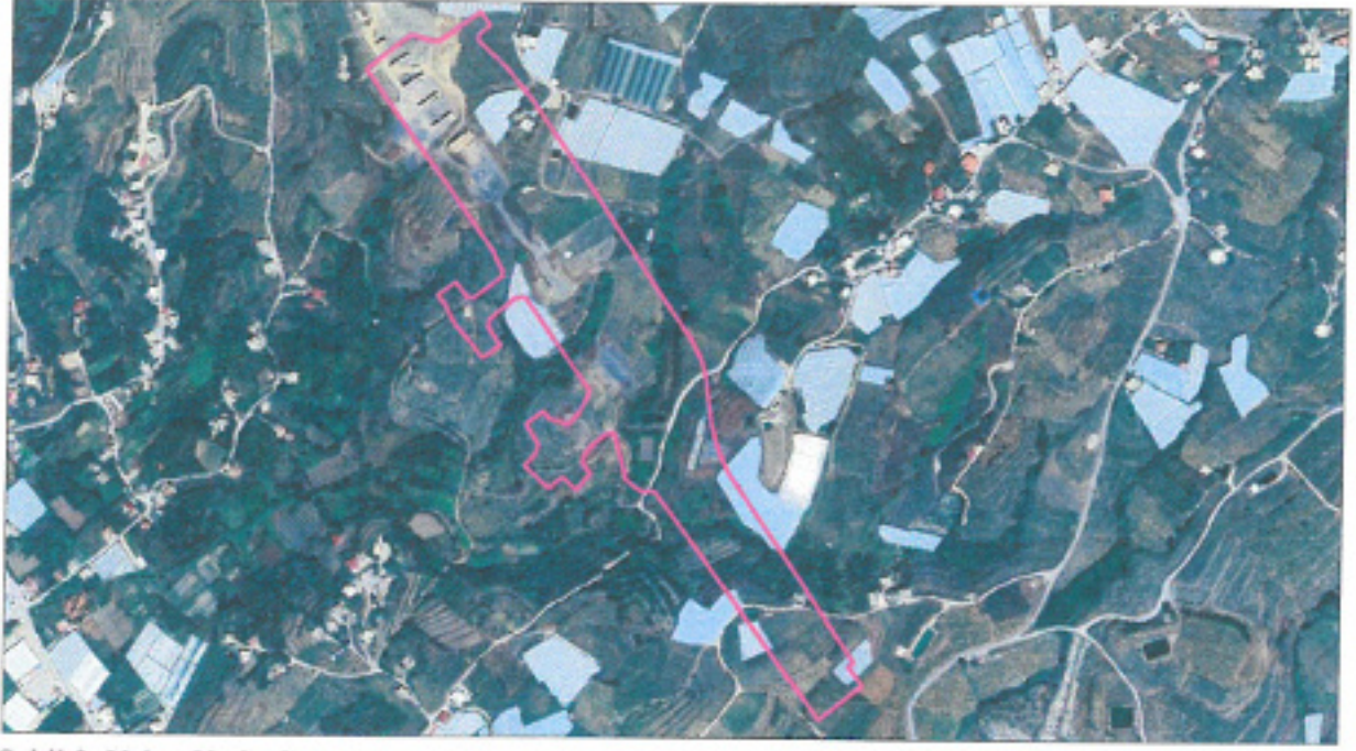
Şekil 3. Yakın Uydu Görüntüsü Bölge-2