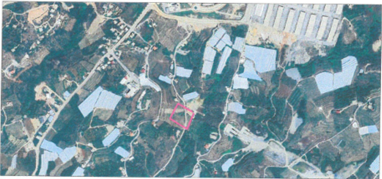
Şekil 2. Yakın Uydü Görüntüsü Bölge-1