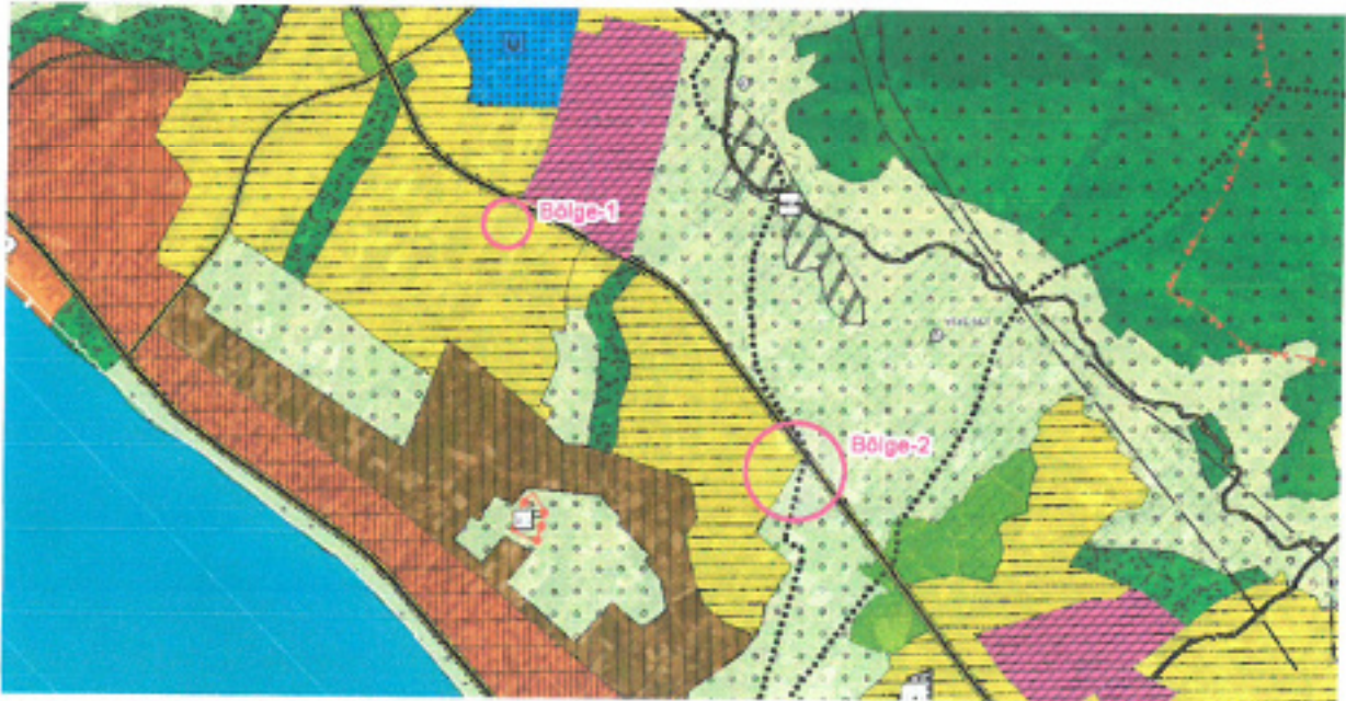
Şekil 4. 1/100.000 Ölçekli Onaylı Çevre Düzeni Planı

Plan değişikliğine konu parsellerin bulunduğu alanda Antalya-Burdur-Isparta Planlama Bölgesi 1/100000 Ölçekli Çevre Düzeni Planı Değişikliği; Çevre, Şehircilik Ve İklim Değişikliği Bakanlığı 08.02.2022 tarihli ve 2913627 sayılı OLUR'u ile 1 Nolu Cumhurbaşkanlığı Kararnamesi'nin 102. maddesi uyarınca onaylanmıştır. Söz konusu planda parsel gelime konut alanı olarak planlıdır.