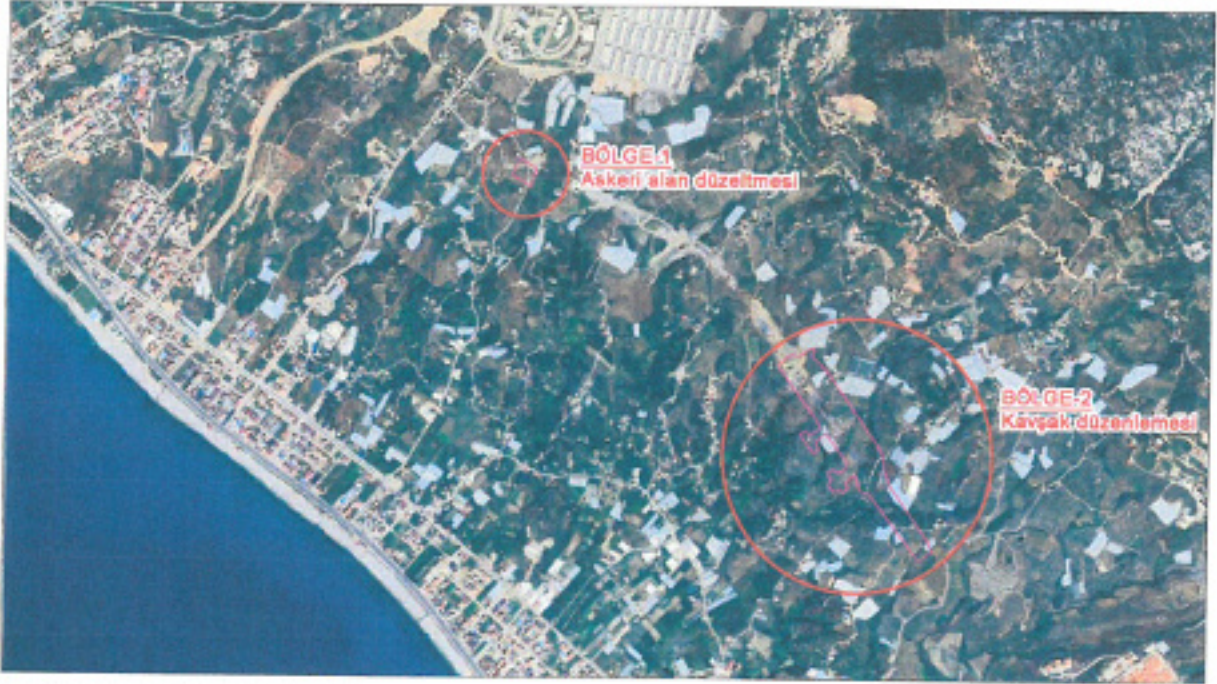
Şekil 1. Uzak Uydü Görüntüsü

Nazım imar planı tadilat teklifine konu bölge Antalya ili, Alanya ilçesi, Kestel Mahallesi, O28D23D, O28D22C numaralı 1/5000 Ölçekli paftada, yapımı devam eden yeni çevre yolu kenarında yer almaktadır. Bölge 2 yaklaşık 13,6 hektar iken bölge 1 ise 0,7 hektardır.