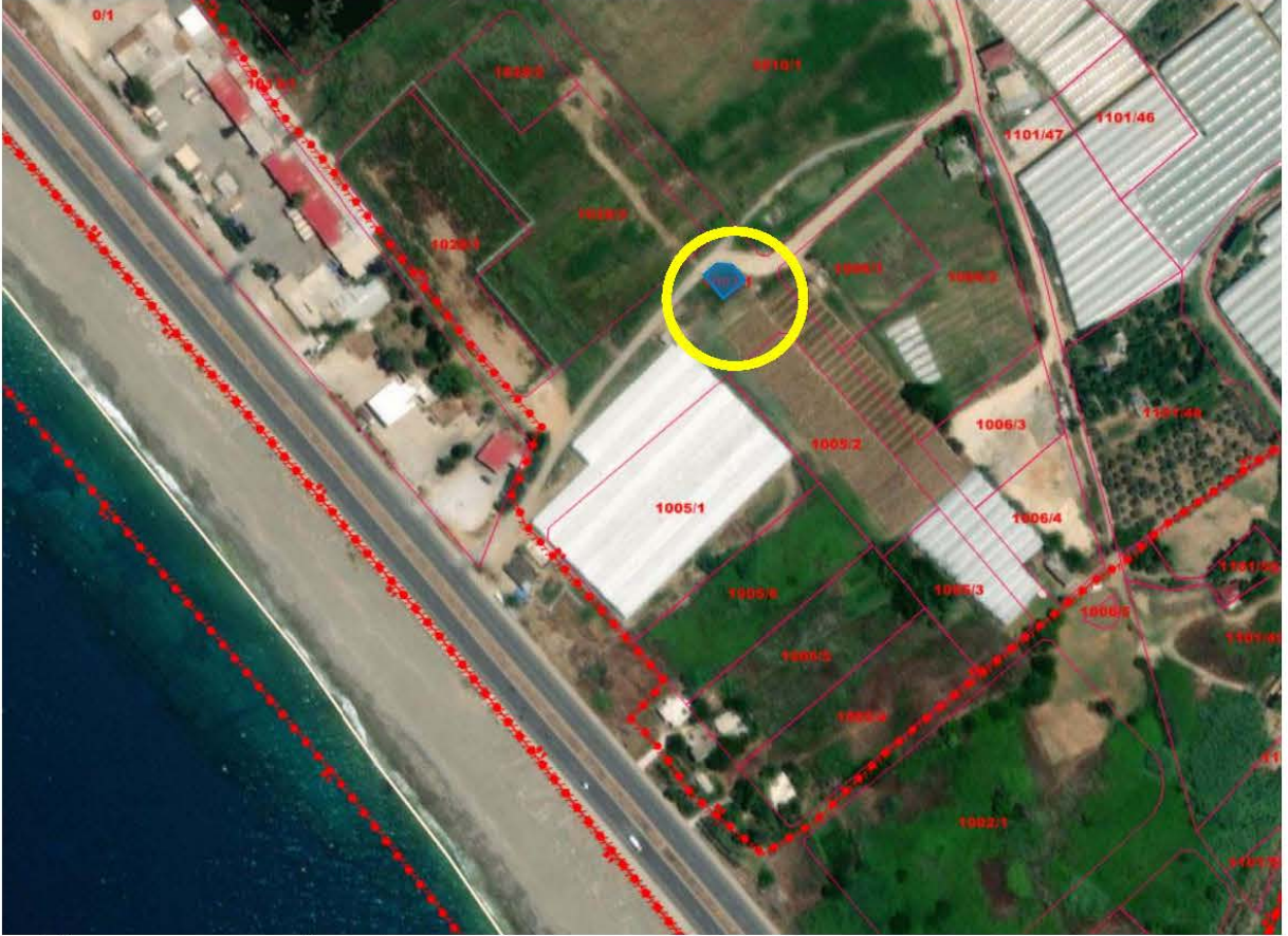
Şekil 2. Hava Fotoğrafi (Yakın)