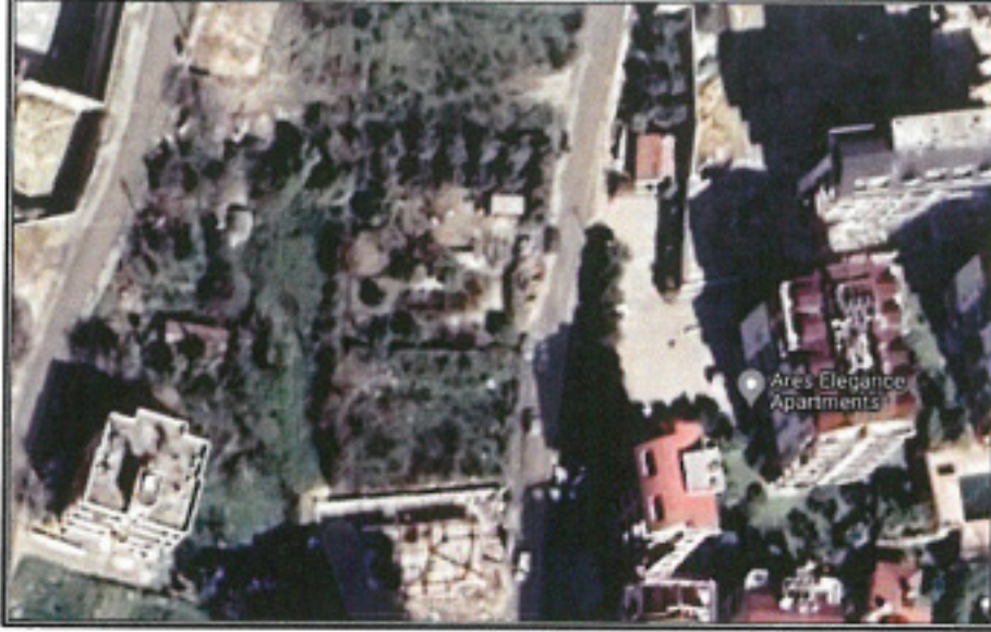
Şekil 1. Hava Fotoğrafi

Antalya İli, Alanya İlçesi, Avsallar mahallesi sınırları içerisinde; O27C11B4B paftasında 205 ada 14 parselin kuzeyinde bulunan park alanı içerisinde trafo alanı planlanması amacı ile 1/1000 ölçekli Uygulama İmar Planı Değişikliği hazırlanmıştır.