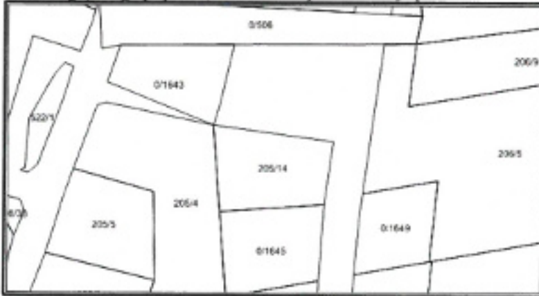
Şekil 2. Parselasyon Planı

Plan değişikliği yapılan; 205 ada 14 parsel kuzeyi park alanı 869 m 2 büyüklüğündedir.