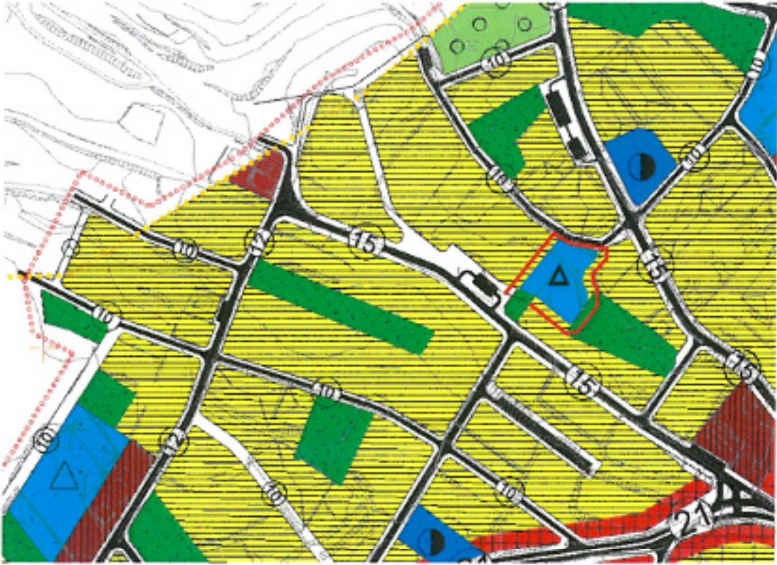
Şekil.3. 539 ada 2 parsel 1/5000 ölçekli Nazım İmar Planı Değişikliği Önerisi

539 ada 2 parsel için mevcut imar planında "Orta Yoğunlukta Gelişme Konut Alanı" olarak belirlenen plan kararı "Eğitim Tesis Alanı" olarak değiştirilmiştir.