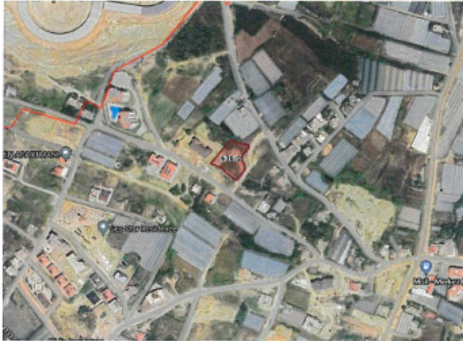
Şekil.1- 539 ada 2 parsel mevcut görünüm

Milli Emlak Müdürlüğü tarafından söz konusu parsel için verilen ön izin belgesinde ise imar planı kararlarına uygun olarak konut ve enerji hariç olmak üzere eğitim, ticari, sağlık, turizm, sanayi, tarım ve hayvancılık, sosyal, kültürel tesisler yapılmak üzere izin verildiği belirtilmektedir. Bu nedenle kiralanan parselin yürürlükteki imar planında konut alanı olarak belirlenmiş olması ve bunun dışındaki bir fonksiyonda ruhsatlandırılması mümkün olmadığından fonksiyon değişikliği için plan tadilatı yapılmasına ihtiyaç duyulmuştur.