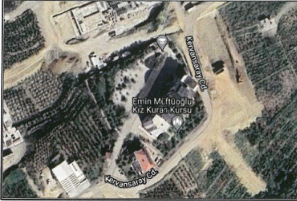
Şekil 1.Hava Fotoğrafı

Antalya İli, Alanya İlçesi, Mahmutlar mahallesi sınırları içerisinde; P28A03A1C paftasında 1088 ada 01 parsel kuzeyinde bulunan park alanında, trafo alanı planlanması amacı ile 1/1000 ölçekli Uygulama İmar Planı Değişikliği hazırlanmıştır.