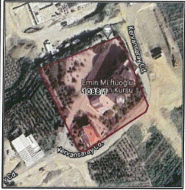
Şekil 2. Parselasyon Planı