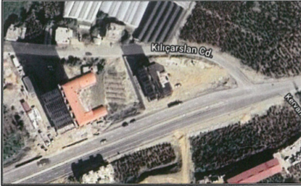
Şekil 1.Hava Fotoğrafi

Antalya İli, Alanya İlçesi, Mahmutlar mahallesi sınırları içerisinde; P28A03A1C paftasında 1060 ada doğusunda bulunan park alanında, trafo alanı planlanması amacı ile 1/1000 ölçekli Uygulama İmar Planı Değişikliği hazırlanmıştır.