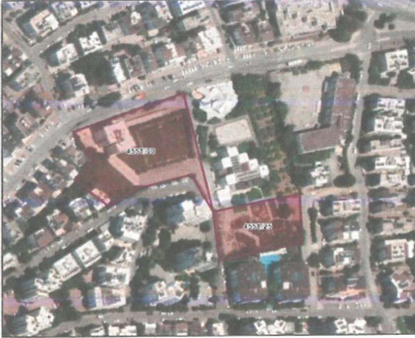
Resim 1: Uydu Fotoğrafı

Antalya İli, (Büyükşehir) Muratpaşa Belediyesi Kızıltoprak Mahallesi sınırları içerisinde tapunun 4551 ada 25 ve 30 parsel numaralarında kayıtlı, toplam 9.469 m 2 büyüklüğündeki taşınmazı konu alan, 19L-1B ve 20L-4C nolu İmar Planı paftalarında yer alan 1/1000 ölçekli uygulama İmar Planı Değişikliği hazırlanmıştır.