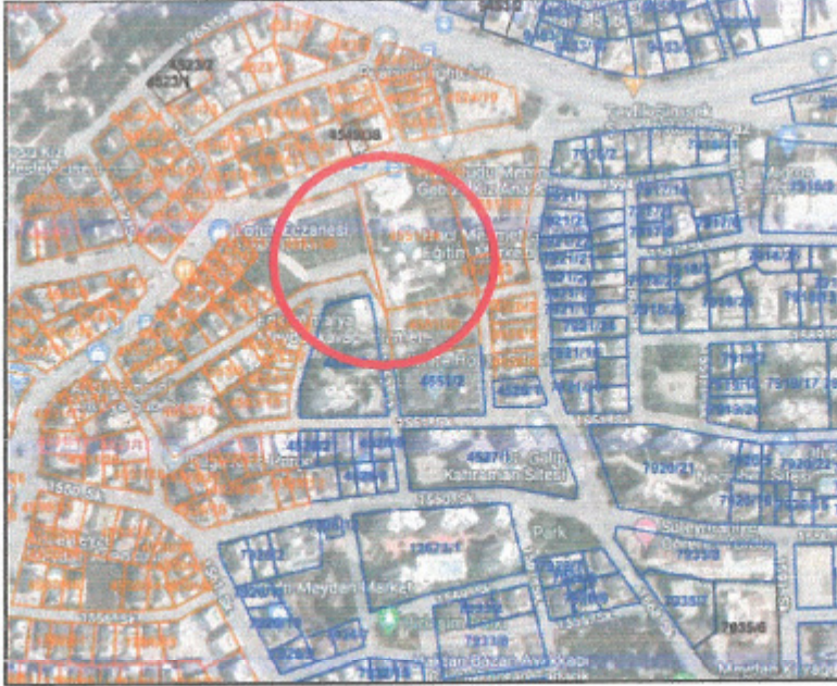
Harita 1: Parselasyon Durumu

Antalya ili, Muratpaşa İlçesi, Kızıltoprak Mahallesi, 4551 ada 25 ve 30 parsellerin parselasyon durumunu ve güncel uydu görüntüsünü gösteren harita aşağıdadır.