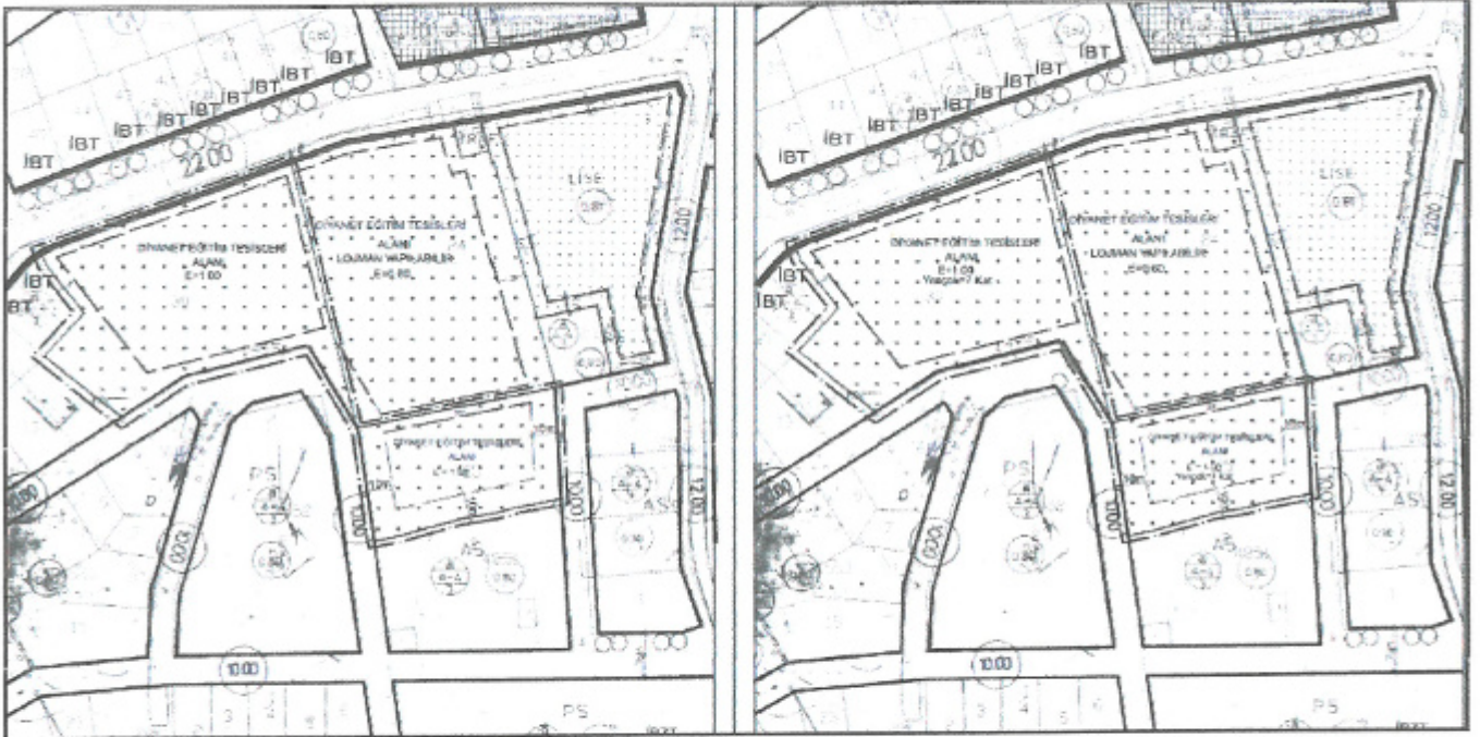
Plan 1: Mevcut ve Öneri 1/1000 ölçekli Uygulama İmar Planı Değişikliği