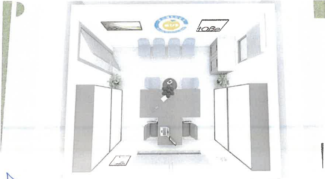
Şekil 2 : KUTSO Tarafından Talep Edilen Alanın/Ofisin 3 Boyutlu Gösterimi