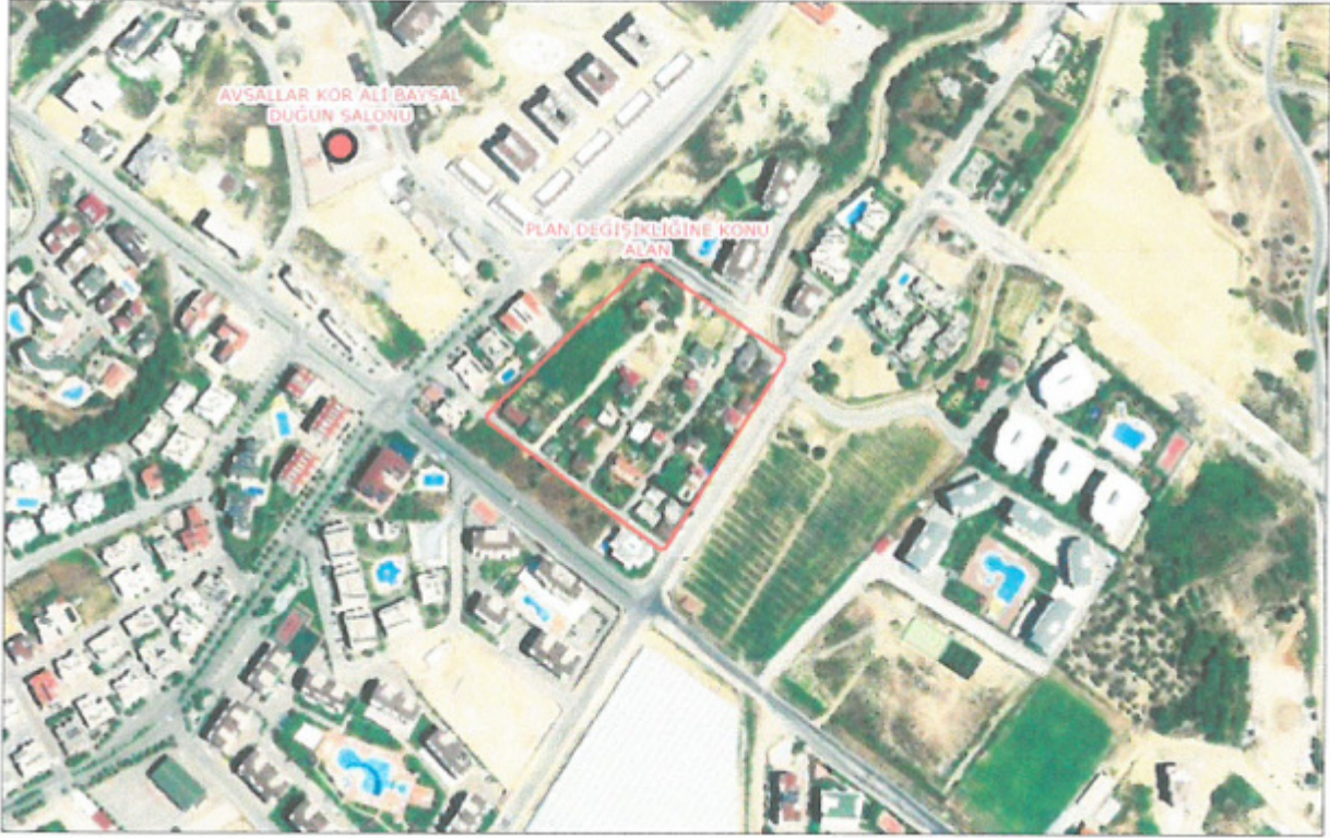
Şekil 2. Yakın Uydu Görüntüsü