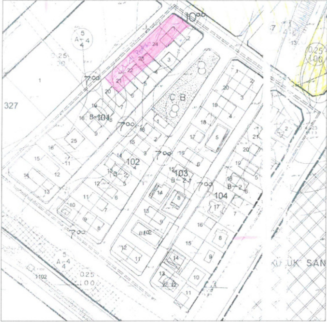
Şekil 3. Mülga Avsallar Belediyesi Zamanında Yapılmış Olan 1/1000 Ölçekli Uygulama İmar Planı

Planlama alanı 101, 102, 103 ve 104 adalar Mülga Avsallar Belediyesi zamanında yapılan imar çalışmalarında parsellerin mevcutta küçük olmasından dolayı bitişik nizam 2 kat olarak planlanmıştır. Zaman içerisinde yapılaşma koşulları dikkate alındığında 2 metre çekme mesafeleri göz önüne alındığında yapılar parseller içerisine sığmadığından dolayı ilgili belediyesince yapılan imar çalışmalarında alan blok nizam 2 kat olarak planlanmıştır. Plan değişikliği ile blok nizam tanımlanmış olsa da bloklar çekme mesafeleri kaynaklı parsel içerisine sığmamakta ve oturacağı taban alanı planda tanımlanmamıştır.