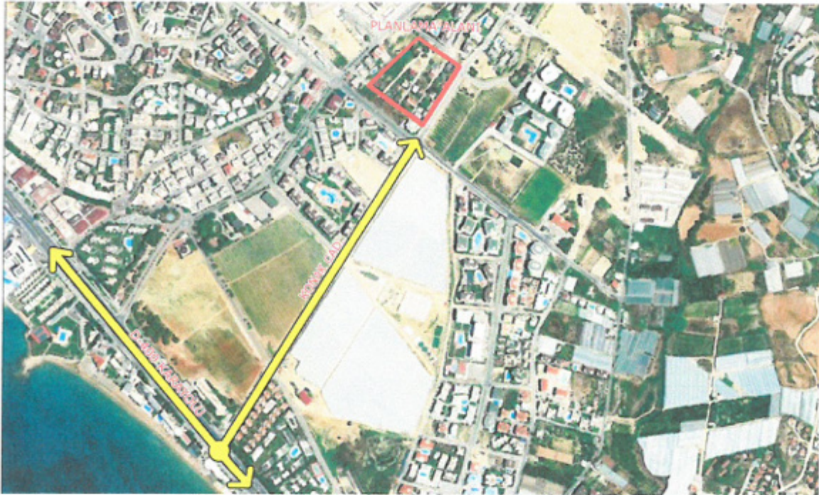
Şekil 1. Uzak Uydu Görüntüsü

Uygulama imar planı tadilat teklifine konu bölge Antalya ili, Alanya ilçesi, Avsallar Mahallesi, O27-C11-C-1-A numaralı 1/1000 Ölçekli paftada, Avsallar Kör Ali Baysal Düğün Salonunun güneydoğusunda bulunan 101, 102, 103, 104 numaralı adaların tamamını içine alan yaklaşık 21902,7 m 2 büyüklüğündeki alanı kapsamaktadır. Plan değişikliğine konu alan Alanya İlçesi Avsallar Mahallesi sahil kesiminde bulunan D400 Karayolunun yaklaşık olarak 850 metre kuzeyinde bulunmaktadır.