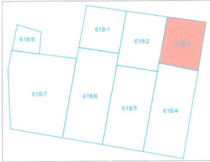
Şekil 5. Kadastral Durum

618 ada 3 parsel tapu kayıtlarına göre 334 m 2 'dir. Plan değişikliğine konu alan 618 ada 3 parselin tamamını kapsamaktadır. Alan içinde yapılaşma olmayıp, içerisinde narenciye ağaçları bulunmaktadır ve araç park yeri olarak kullanılmaktadır.