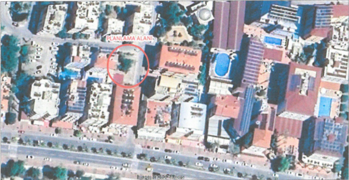
Şekil 2. Yakın Uydur Görüntüsü