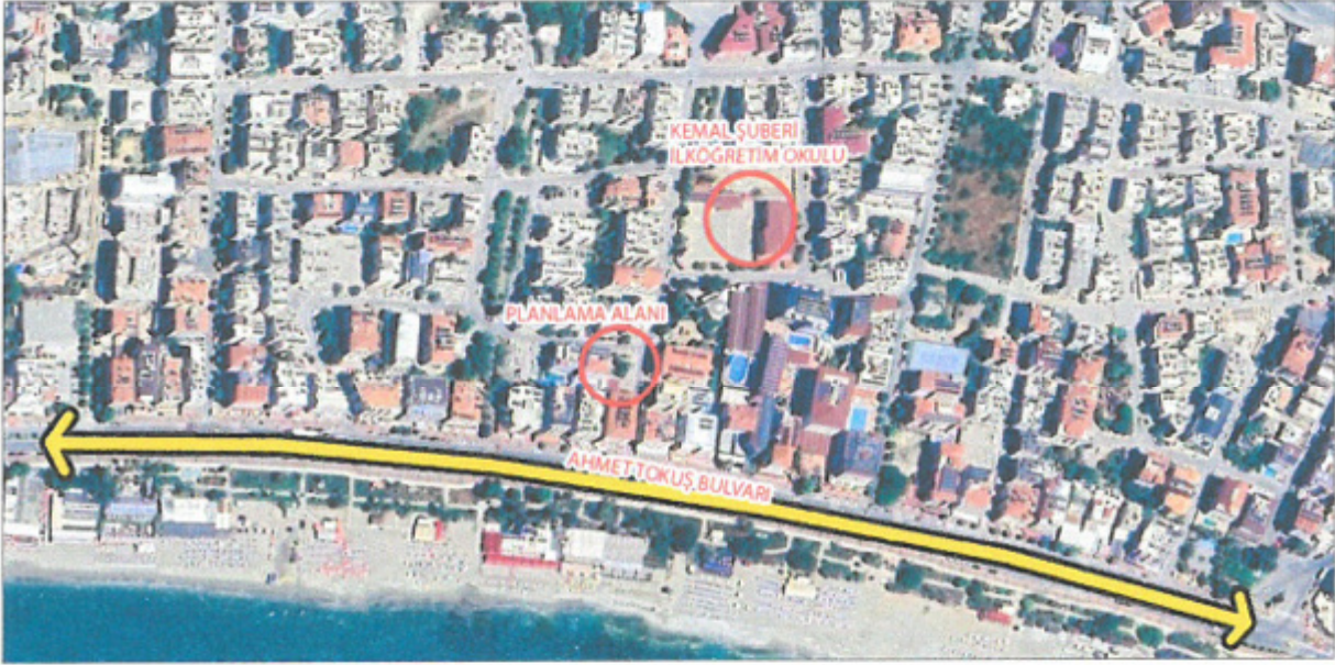
Şekil 1. Uzak Uydur Görüntüsü

Uygulama imar planı tadilat teklifine konu bölge Antalya ili, Alanya ilçesi, Kellerpınarı Mahallesi, O28-D-21-A-2-A numaralı 1/1000 Ölçekli paftasında kalan yaklaşık 334 m 2 'lik alanı kapsamaktadır. Plan değişikliğine konu alan Alanya İlçesi Kellerpınarı Mahallesi, Ahmet Tokuş Bulvarı üzerinde, Kemal Şuberi İlköğretim okulunun yaklaşık 100 metre güneybatısında bulunmaktadır.