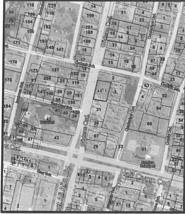
Uydu Fotoğrafları ve Kadastral Durum

Planlama konusu 46 ada 1 parsel Antalya İli Kumluca İlçesi Bağlık Mahallesi sınırları içerisinde 220-2D nolu 1/1000 ölçekli uygulama imar planı paftasında, Kumluca ilçe merkezinde Gödene Caddesi'ne cepheli konumda yer almaktadır.