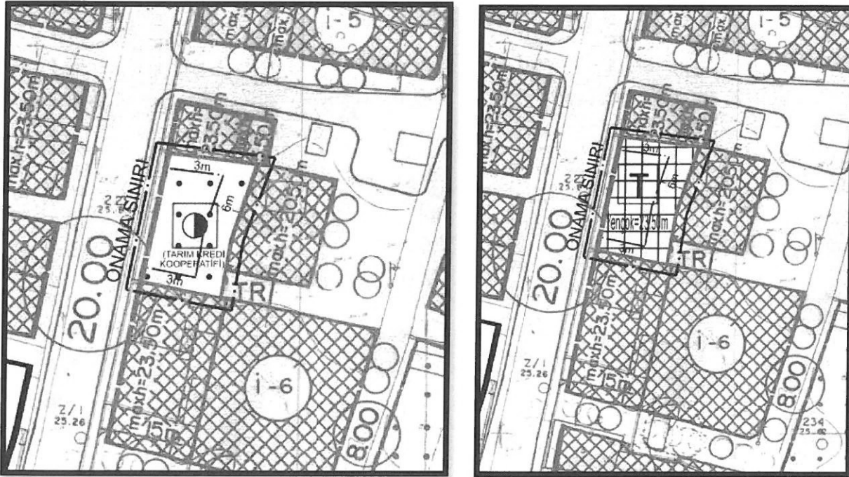
Mevcut ve Taslak Öneri 1/1000 Uygulama İmar Planı

Yapılan plan değişikliği ile mevcut imar planlarında yer alan yapılaşma koşulları korunacak şekilde parsel Ticaret Alanı olarak planlanmıştır. Söz konusu parselle ilişkin yürürlükteki imar planlarında yer alan "Üst katlarda konut yer alamaz" plan notu alt ölçekli uygulama imar planında da eklenmiştir.