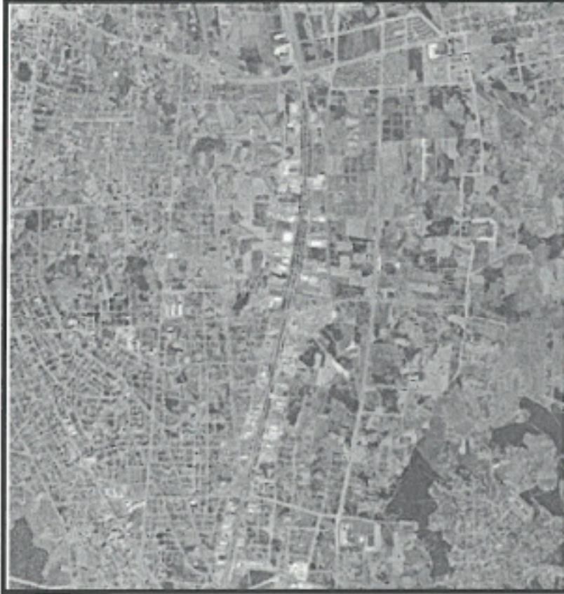
Şekil 1: Plan değişikliğine konu alanın uydu görüntüsü.

Plan değişikliğine konu olan alan, Döşemealtı İlçe merkezinin yaklaşık 5000 metre güneyinde; Antalya il merkezinin yaklaşık 12 Km kuzeyinde ve Antalya-Burdur Karayolu'nun batısında ve doğusunda bulunmaktadır.