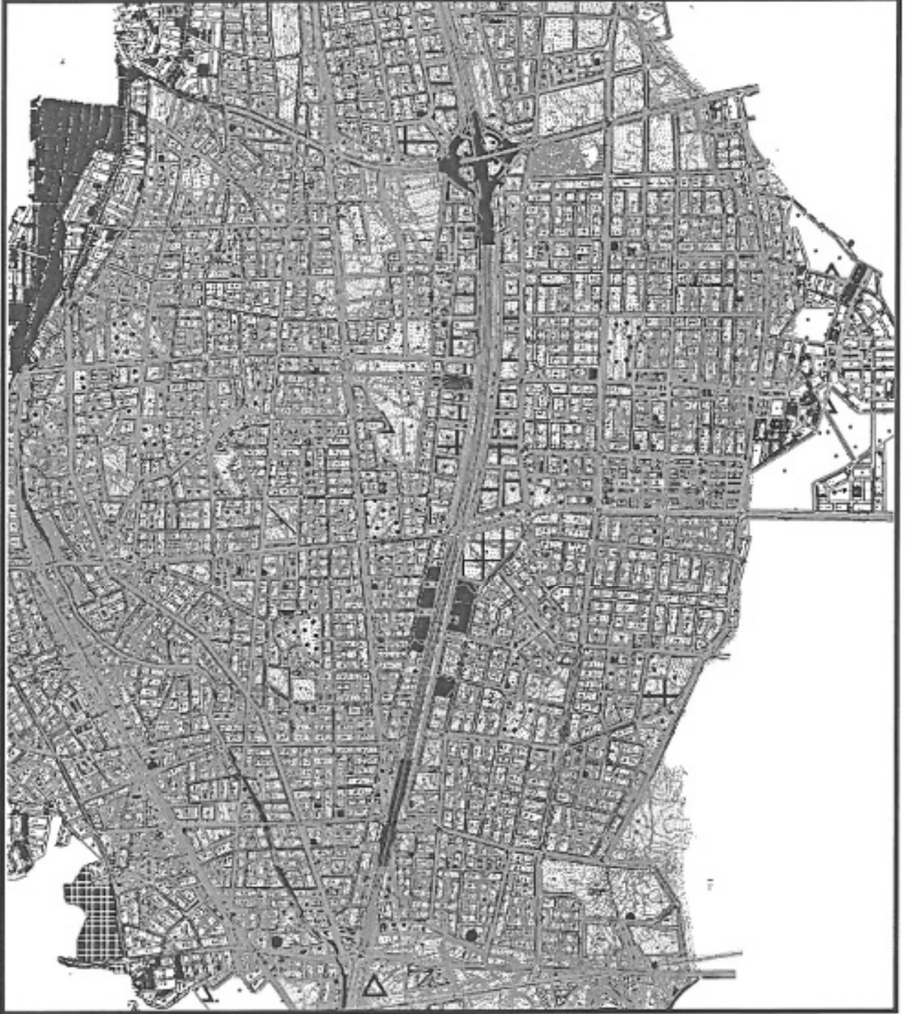
Şekil 3: 1/1000 ölçekli Uygulama İmar Planı