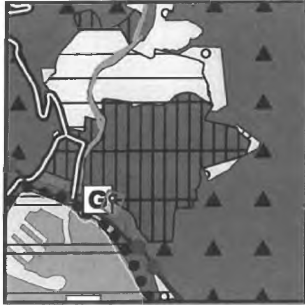
1/25.000 Ölçekli Nazım İmar Planında Planlama Alanı Konumu

Planlama alanına ilişkin olarak Antalya Büyükşehir Belediyesi Meclisi'nin 16.05.2022 tarih ve 396 sayılı kararı ile onaylı 1/25000 Ölçekli Nazım İmar Planı bulunmaktadır. Planlama konusu parsel bu planlarda Turizm-Ticaret-Konut karma kullanım alanı olarak planlanmıştır.