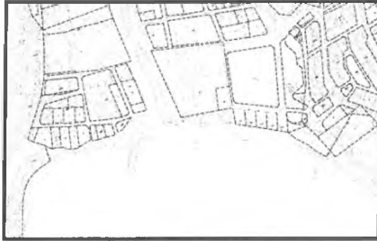
Uydu Fotoğrafı, Halihazır ve Kadastral Durum