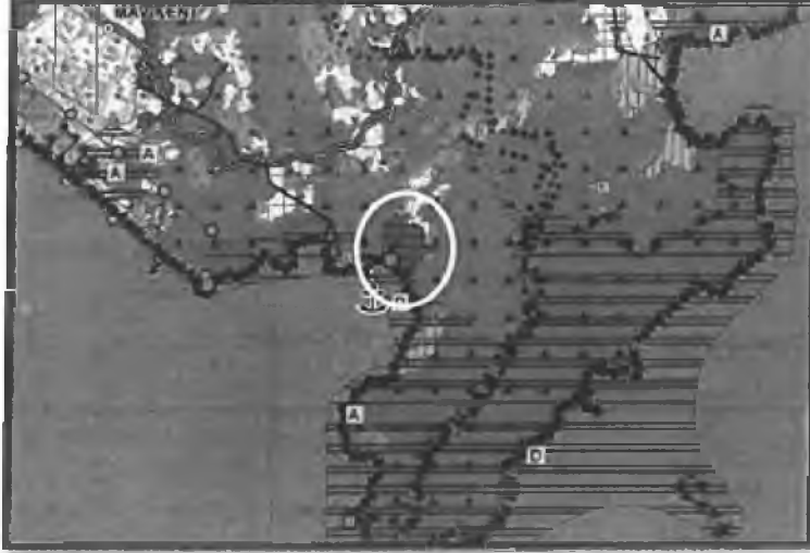
1/100.000 Ölçekli Çevre Düzeni Planında Planlama Alanı Konumu

Planlama konusu 109 ada 1 nolu parsel Kumluca İlçesi Karaöz Mahallesi sınırları içerisinde yer almaktadır. Söz konusu parseller Antalya-İsparta-Burdur 1/100.000 Ölçekli Çevre Düzeni Planı'nda Kentsel Yerleşim Alanı olarak planlanmıştır.