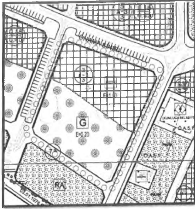
Öneri 1/1000 Ölçekli Uygulama İmar Planı

A. Mustafa DEMİRAY Şehir Plancısı Kepeci Mah. 106. Cad. No:51/12-Merkez Tel:(0.506)441 63 88 - ISPARTA Davraz V.D.T.C. 129 324 010 48