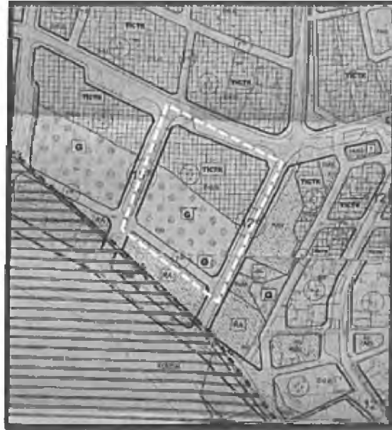
Mahkeme Konusu 109 Ada 1 Parsel Plan Durumu

Yürürlükteki 1/5000 Ölçekli Nazım İmar Planına göre hazırlanan mahkemeye konu Kumluca Belediyesi Meclisi'nin 03.01.2019 tarih ve 5 sayılı kararı ve Antalya Büyükşehir Belediyesi Meclisi'nin 14.02.2019 tarih ve 154 sayılı kararı ile onaylanan 1/1000 Ölçekli Uygulama İmar Planı'nda Kıyı Kenar Çizgisi'nin ikinci 50m kısmında Günübirlik Tesis Alanı, kalan kısmı ise Ticaret-Konut-Turizm Karma Kullanım Alanı (TİCTK-E=0.45) olarak planlanmıştır.