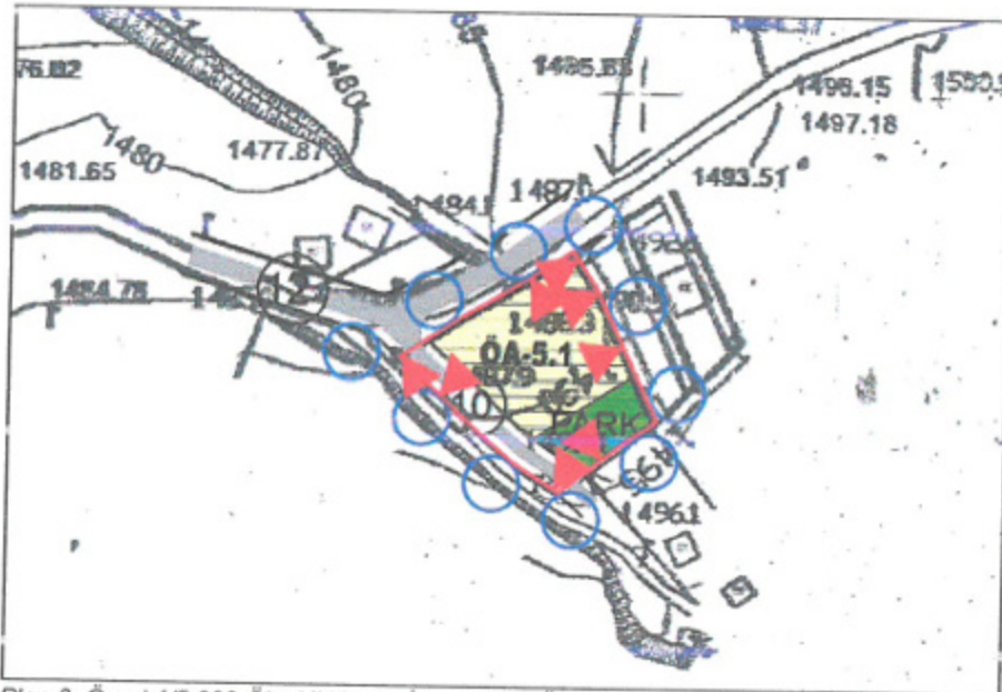
Plan 3: Öneri 1/5.000 Ölçekli Nazım İmar Planı (Ölçeksiz)

Planlama alanında yapılan alan hesapları ve nüfus hesapları neticesinde 1/5000 ölçekli Nazım imar planında brüt yoğunluk 86 kişi/ha olarak hesaplanmıştır. Söz konusu brüt yoğunluk değeri Mekânsal Planlar Yapım Yönetmeliğinin Nazım İmar Planı Gösterimler (Ek-1ç)'de "Düşük Yoğunlukta Gelişme Konut Alanı" olarak tanımlanmıştır. Söz konusu gösterim 1/5000 ölçekli Nazım İmar Planı kararlarında ve lejantında gösterilmiştir.