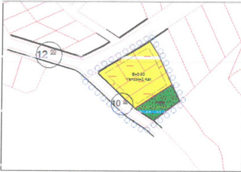
Plan 4: Taslak 1/1.000 Ölçekli Uygulama İmar Planı (Ölçeksiz)