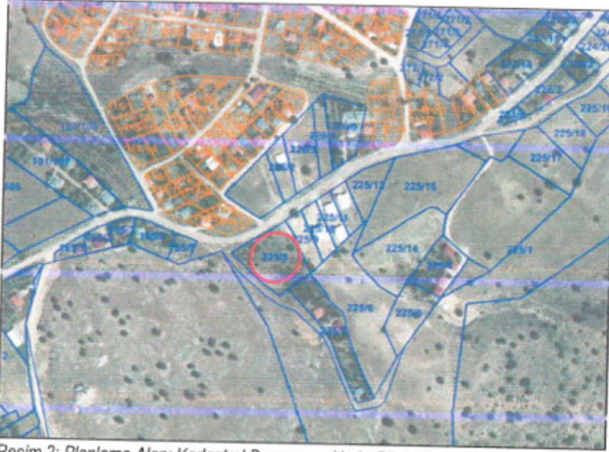
Resim 2: Planlama Alanı Kadastral Durumu ve Uydu Görüntüsü

Söz konusu planlama alanını kapsayan; Antalya İli Korkuteli İlçesi, Yeleme Mahallesi Köy Yerleşik Alan sınırları içinde tapunun 225 ada 8 parseline kayıtlı taşınmaz tamamen boş olup, parsel üzerinde herhangi bir korunması gerekli tabiat veya kültür varlığı bulunmamaktadır. Ayrıca parsel üzerinde herhangi bir tarımsal faaliyet bulunmamaktadır. Söz konusu parsel tapu kayıtlarında 3678.56 m 2 'dir. Planlamaya konu parselin kadastral durumu güncel uydu görüntüsü ile birlikte gösterildiği harita aşağıdaki gibidir.