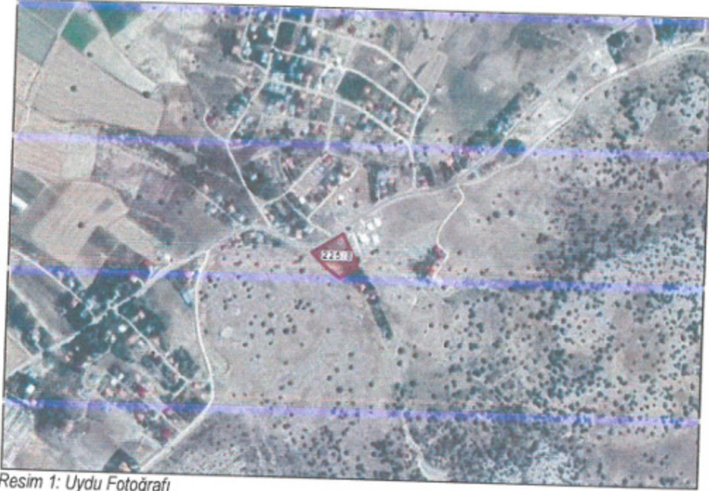
Resim 1: Uydu Fotoğrafı

Antalya ili, Büyükşehir Belediyesi (Korkuteli) , Yeleme Mahallesi sınırları içinde tapunun 225 ada 8 parseli kapsayan, yaklaşık 0,3 ha büyüklüğündeki alanda N24-D-07-C numaralı 1/5000 ölçekli Nazım İmar Planı paftasına giren 1/5000 ölçekli Nazım İmar Planı hazırlanmıştır.