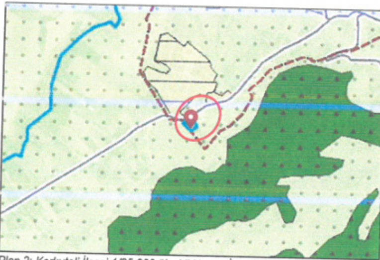
Plan 2: Korkuteli İlçesi 1/25.000 ölçekli Nazım İmar Planı