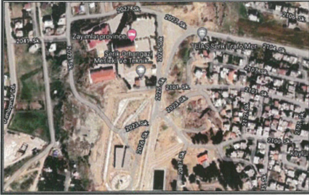
Şekil 1. Hava Fotoğrafı

Antalya İli, Serik İlçesi sınırları içerisinde Merkez mahallesi O26A 07B 3D paftalarında 175 ada 118 parsel içerisinde Millet Bahçesinin kuzeyinde yer alan ve park olarak planlanmış alan içerisinde trafo alanı planlanması amacı ile 1/1000 ölçekli Uygulama İmar Planı Değişikliği hazırlanmıştır.