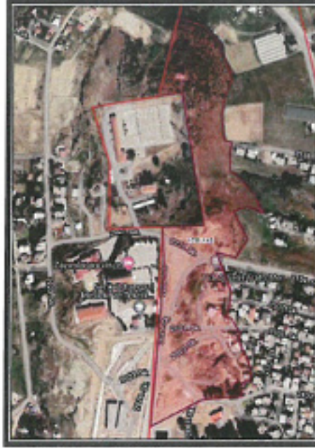
Şekil 2. Parselasyon Planı