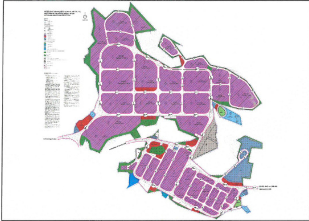
Şekil 4. Mevcut 1/1.000 Ölçekli Uygulama İmar Planı