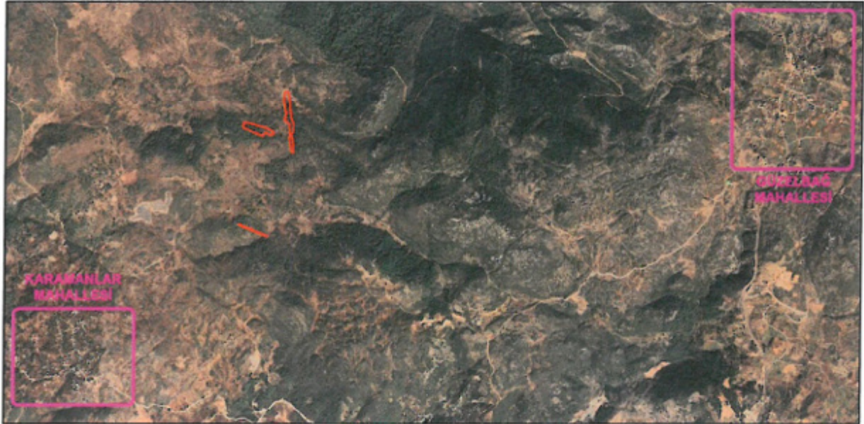
Şekil 1. Hava Fotoğrafi

1/1000 Ölçekli uygulama imar planı değişikliği teklifi; Antalya ili, Alanya ilçesi, Güzelbağ Zafer Mahallesi, O27-C-02-B-3-D, O27-C-2-B-3-C, O27-C-2-C-2-A, O27-C-2-C-2-B, O27-C-2-C-2-C, O27-C-2-C-2-D no'lu plan paftalarında yer alan, 169 ada 38, 93, 94, 95, 96, 97, 98, 99, 102, 103, 206, 220 (orman vasıflı); 175 ada 36, 48; Orhanköy 107 ada 1 (orman vasıflı) parselin bir kısmı ve çevresini kapsamaktadır. Plan değişikliğine konu alanın toplam yüz ölçümü yaklaşık 3.8 hektardır.