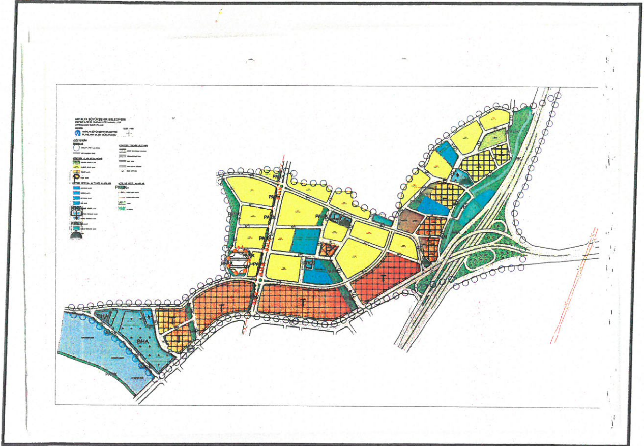
Şekil 3. 1/1000 ölçekli Uygulama İmar Planı

Antalya Büyükşehir Belediyesi Şehir Plancısı