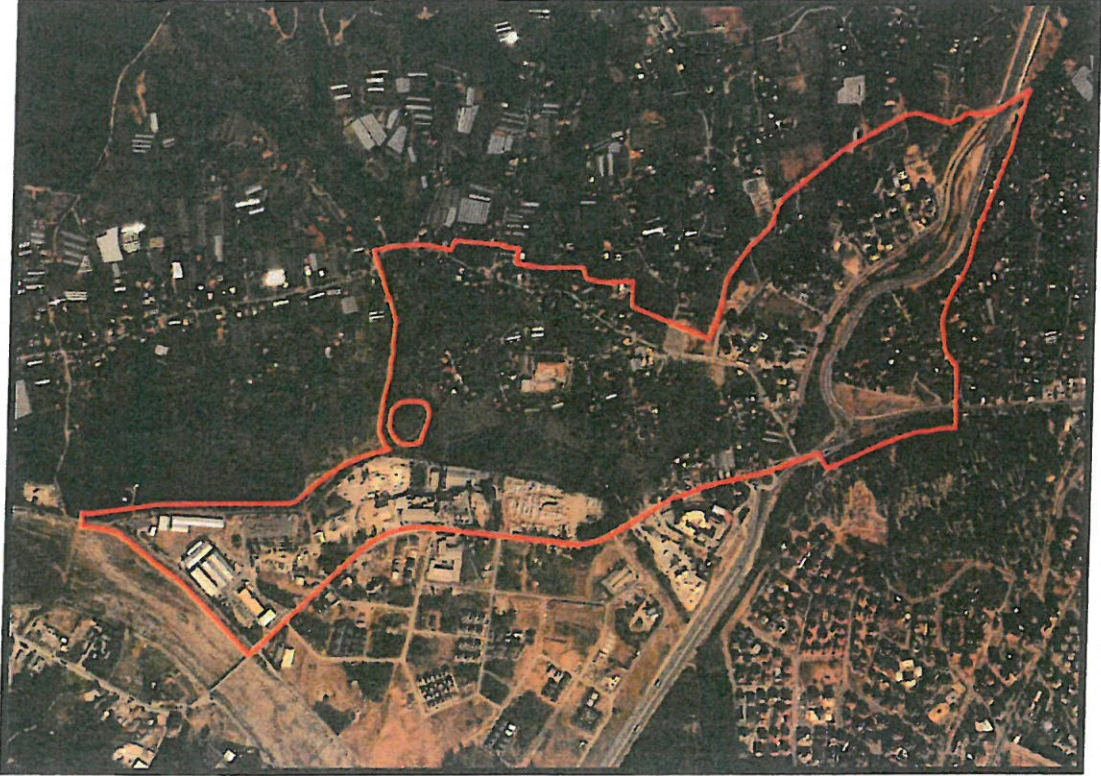
Şekil.1 Hava Fotoğrafi

Planlama Alanı Antalya İli, Kepez İlçesi sınırları içerisindeki Duraliler Mahallesi ve yakın çevresini kapsamakta olup O25A-08C-4A, O25A-08C-4D, O25A-08D-3B, O25A-08D-3C, O25A-08D-3D, O25A-08D-4C, O25A-13A-1A, O25A-13A-1B, O25A-13A-2A, O25A-13A-2B nolu 1/1000 ölçekli Uygulama İmar Planı paftaları içerisinde kalmaktadır.