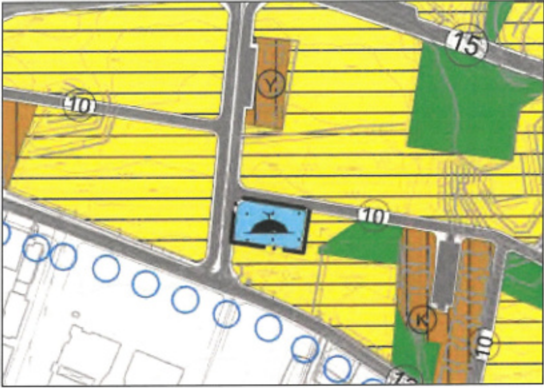
Şekil 5. Planlama konusu alanın 1/5.000 Ölçekli Nazım İmar Planı'ndaki yeri