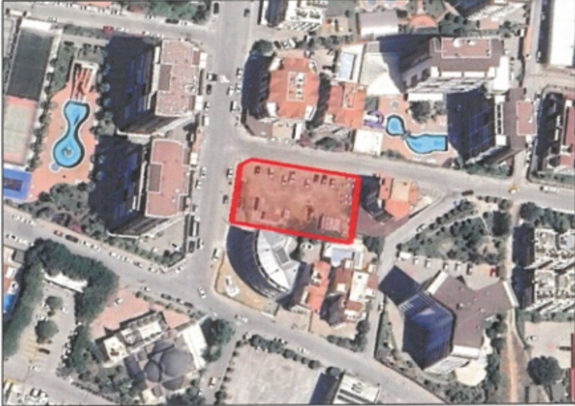
Şekil 1. Planlama konusu alanı ve yakın çevresini gösterir uydu görüntüsü

1/1.000 ölçekli uygulama imar planı teklifi Antalya İli, Alanya İlçesi, Cıkıllı Mahallesi sınırları içerisinde O28-d-21-b-1-b no.lu 1/1.000 ölçekli hâlihazır paftasında kalan, yaklaşık 0.2 ha yüz ölçümlü, 344 ada 1 ve 6 no.lu parsellerin tamamını kapsamaktadır (Şekil.1). Planlama alanının batısında Azakoğlu Caddesi, 40 m güneyinde Eğriköprü Caddesi bulunmaktadır.