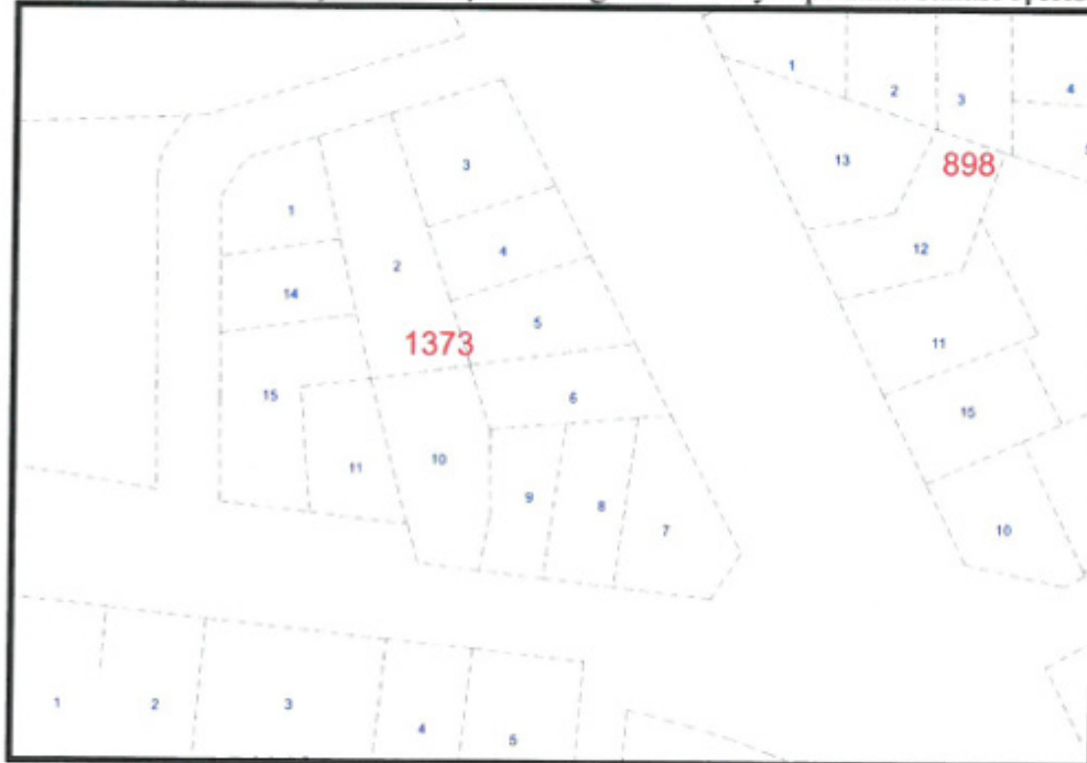
Şekil 2. Kadastral Durum

1373 ada 6 parsel Döşemealtı İlçesi Kırgöz Yeniköy tapulama sahası içerisinde yer almaktadır.