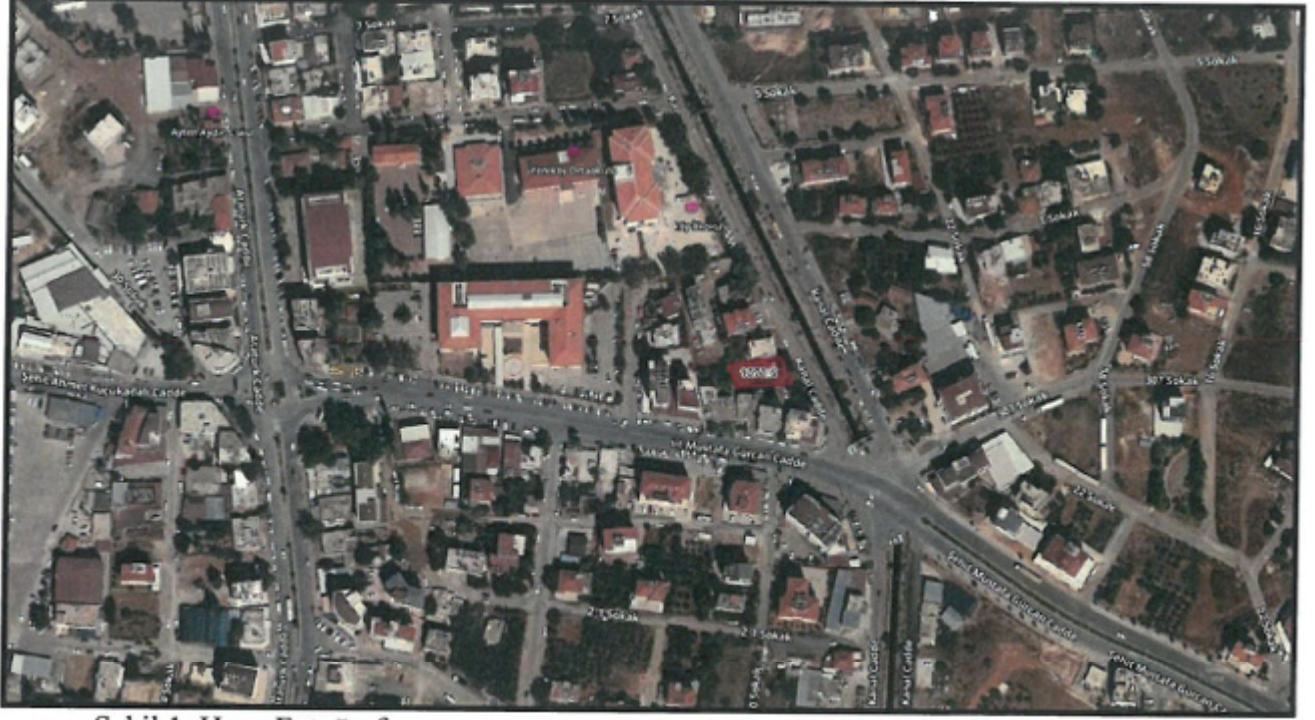
Şekil 1. Hava Fotoğrafı

Antalya İli Döşemealtı ilçesi sınırları içerisinde N25D-23D-1A nolu 1/1000 ölçekli uygulama imar planı paftasında yer almaktadır