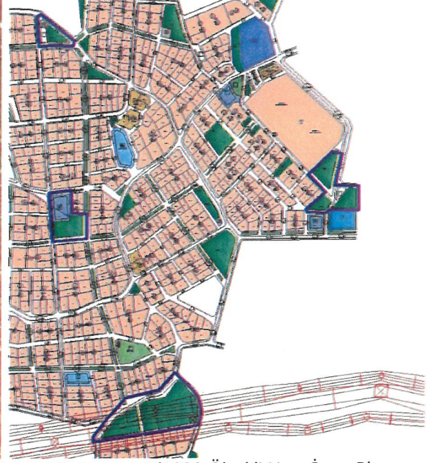
Resim 2: Mevcut 1/1000 Ölçekli Uyg. İmar Planı