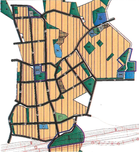
Resim 3: Mevcut 1/5000 Ölç. N. İmar Planı