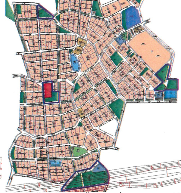
Resim 4: Öneri 1/1000 Ölç. Uyg. İm. Pl. Rev Taslak

Duacı Mahallesinde 1/1000 ölçekli uygulama imar planında Pazar yeri ayrılmamıştır ancak 117 ada batısındaki kamu hizmet alanı ile park alanının bir kısmı halihazırda Pazar yeri olarak kullanılmaktadır. Fiiliyattaki kullanımına uygun olacak biçimde bu mahallemize bir Pazar alanı ayrılması ve üzerinin kapatılarak orada yaşayan ve hizmet ettiği halkın kullanımına daha etkin bir şekilde Belediyemizce sunulması gerekmektedir. Bu nedenle Belediyemizce halihazırda Pazar olarak kullanılan alanın Pazar yeri olarak düzenlenmesine yönelik 1/1000 ölçekli uygulama imar planı revizyonu taslağı