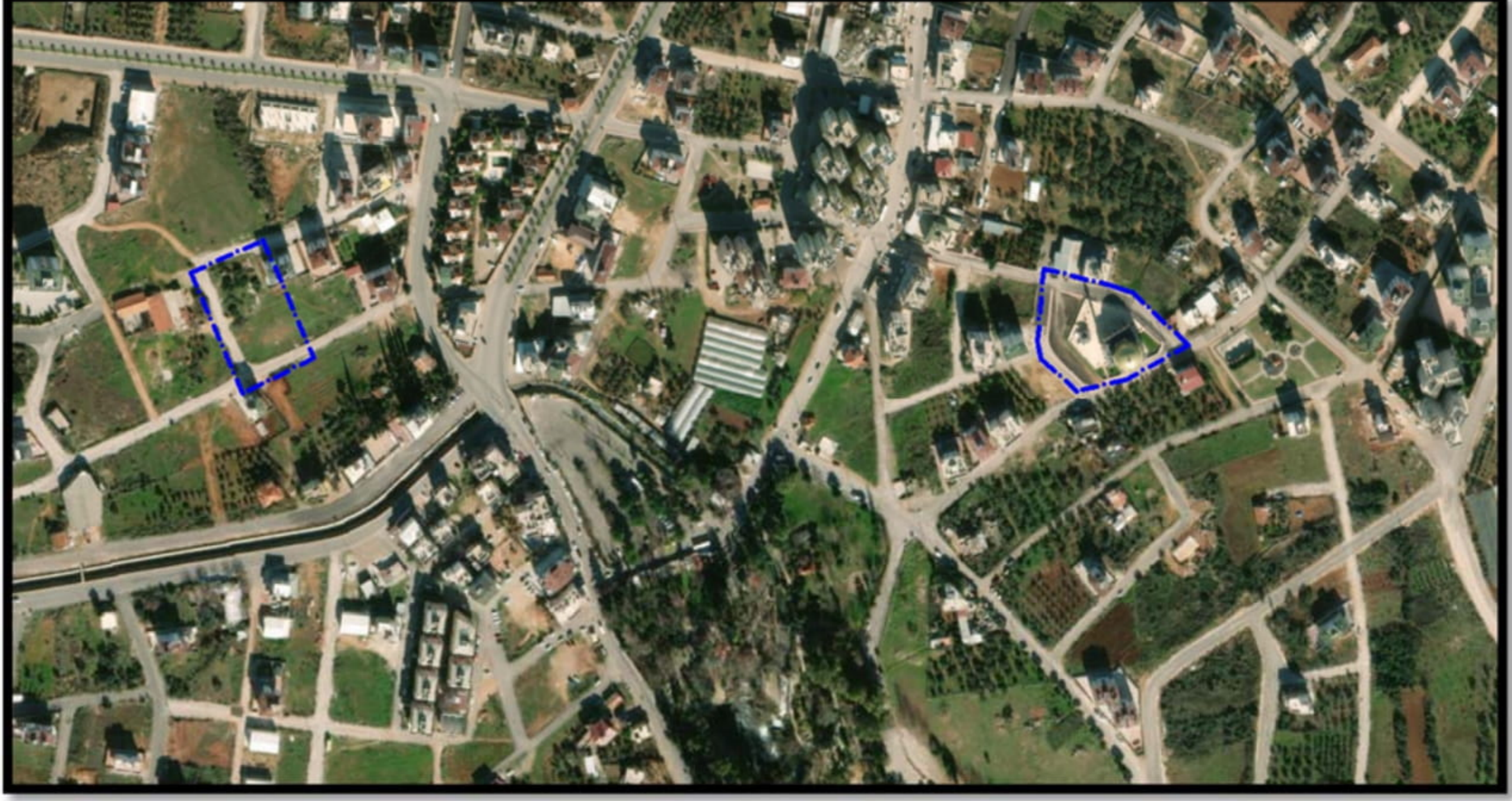
Resim 1: Uydu Görüntüsü

Plan değişikliğine konu alan; Antalya İli, Kepez İlçesi, Şelale Mahallesi, O25A-05C nolu 1/5000 ölçekli Nazım İmar Planı paftasında yer alan, 29527 adada bulunan İbadet Alanı ve Ayanoğlu Mahallesi, O25A-05D nolu 1/5000 ölçekli Nazım İmar Planı paftasında yer alan 624 ada batısı Otopark Alanını kapsamaktadır. (Bkz: Resim 1)