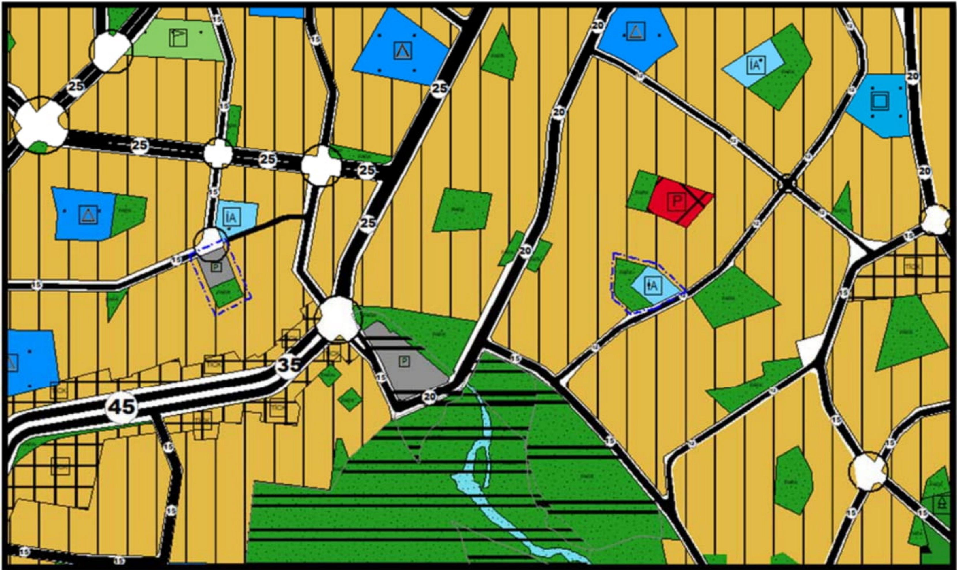
Resim 2: Mevcut 1/5000 Ölçekli Nazım İmar Planı

Mevcut 1/5000 ölçekli Nazım İmar Planında; 29527 adanın bir kısmı İbadet Alanı olarak planlı, bir kısmı ise Park Alanı olarak planlıdır. 624 ada batısında bulunan Otopark Alanının da güneyinde Park Alanı bulunmaktadır.(Bkz: Resim 2)