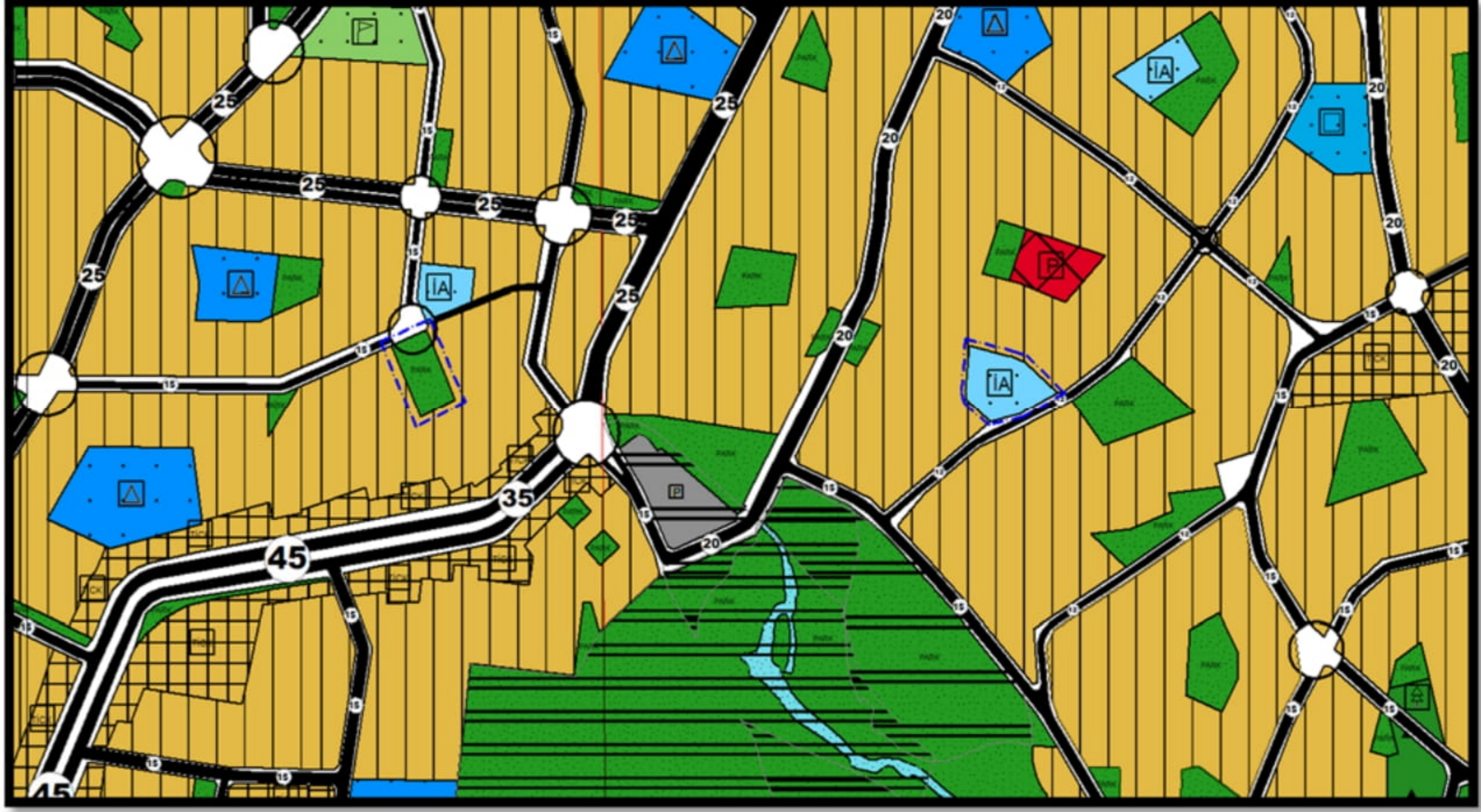
Resim 3: Öneri 1/5000 Ölçekli Nazım İmar Planı

Kepez İlçe Müftülüğünün 02.09.2024 tarih ve 5421085 sayılı yazısındaki; 29527 ada 1 parselde bulunan Karacaahmetler Ahmet Bilgin Cami alanının genişletilmesi talebine istinaden hazırlanan öneri 1/5000 ölçekli Nazım İmar Planında, 29527 adanın tamamı İbadet Alanı olarak düzenlenmiş ve aralarında yaklaşık 600 m. mesafe bulunan Otopark Alanı da aynı adadaki park ile birleştirilerek tamamı Park Alanı olarak düzenlenmiştir. (Bkz: Resim 3)