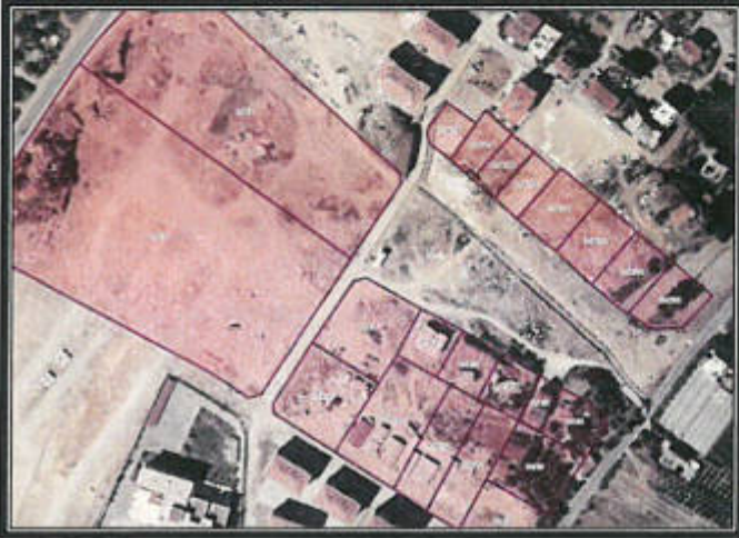
Şekil 2. Parselasyon Planları

Plan değişikliği yapılan Çeltikçi mahallesi 179 ada 9 parsel kuzeyinde bulunan park alanı 8208 metrekaredir.