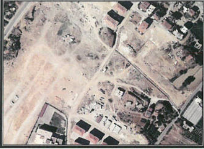
Şekil 1. Hava Fotoğrafları

Antalya İli, Manavgat İlçesi, Çeltikçi mahallesi sınırları içerisinde O26B 25A 2B paftasında yer alan 179 ada 9 parsel kuzeyinde bulunan park alanı içerisinde Trafik Alanı ile ilgili 1/1000 ölçekli Uygulama İmar Planı Değişikliği hazırlanmıştır.