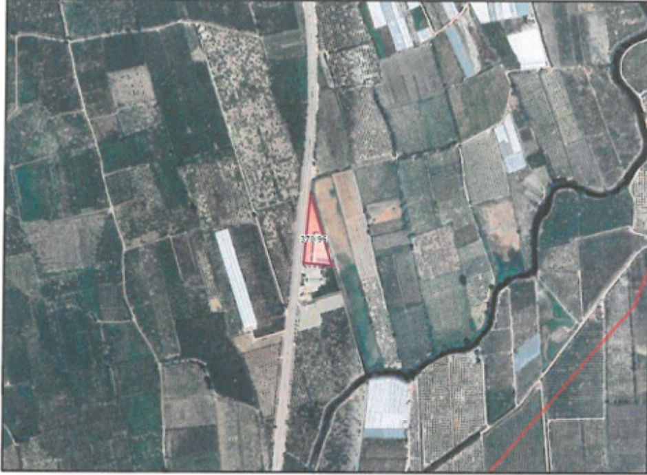
Şekil 1. Planlama konusu alanı ve yakın çevresini gösterir uydu görüntüsü

1/5.000 ölçekli nazım imar planı değişikliği teklifi Antalya ili, Finike ilçesi, Turunçova Mahallesi sınırları içerisinde, P24-a-19-a no.lu 1/5.000 ölçekli hâlihazır paftasında kalan 370 ada 96 parsel no.lu taşınmazın tamamını kapsamaktadır.