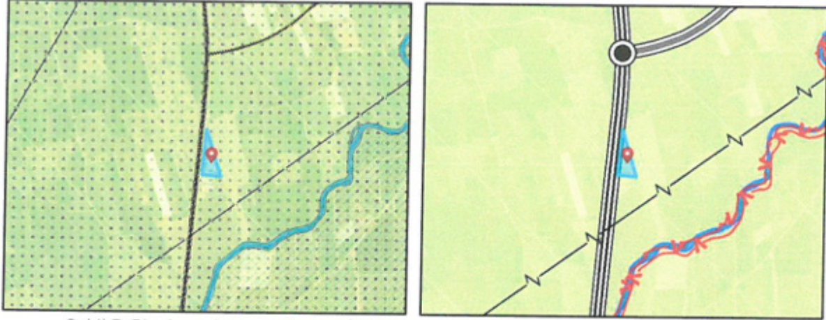
Şekil 3. Planlama konusu alanın 1/100.000 ölçekli çevre düzeni planı değişikliği ve 1/25.000 ölçekli nazım imar planındaki yeri

Taşınmaz Çevre, Şehircilik ve İklim Değişikliği Bakanlığı'nca 08.02.2022 tarihinde onaylanan Antalya-Burdur-Isparta Planlama Bölgesi 1/100.000 Ölçekli Çevre Düzeni Planı Değişikliği'nde "tarım alanı", Antalya Büyükşehir Belediyesi Meclisi'nce 09.03.2020 tarihinde onaylanan Antalya İli Finike İlçesi 1/25.000 Ölçekli Nazım İmar Planı'nda ise "tarım alanları" olarak tanımlanmıştır.