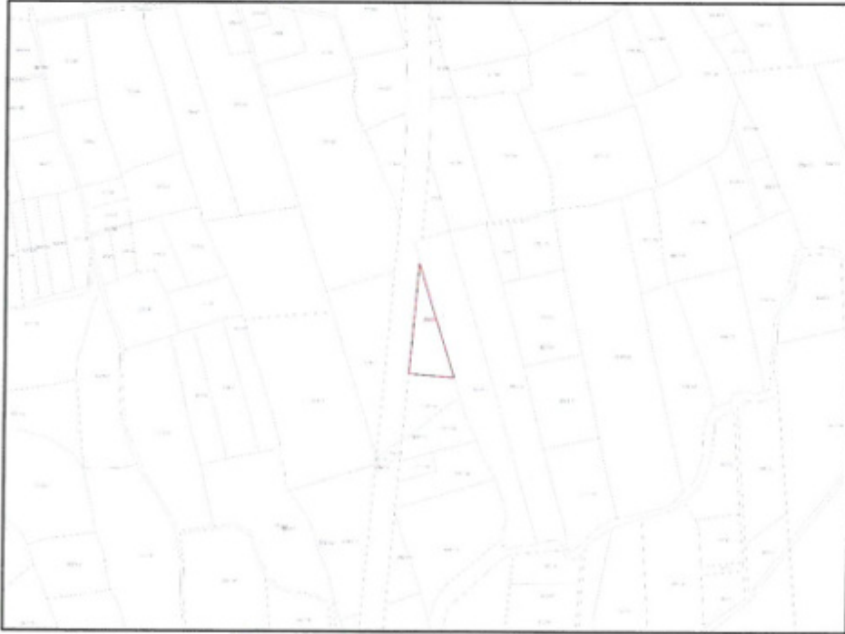
Şekil 2. Taşınmaz ve çevresinin mülkiyet sınırlarını gösterir kroki

Özel mülkiyete konu taşınmazın yüz ölçümü 7.031,93 m 2 olup tapuda narenciye bahçesi vasfı ile kayıtlıdır.