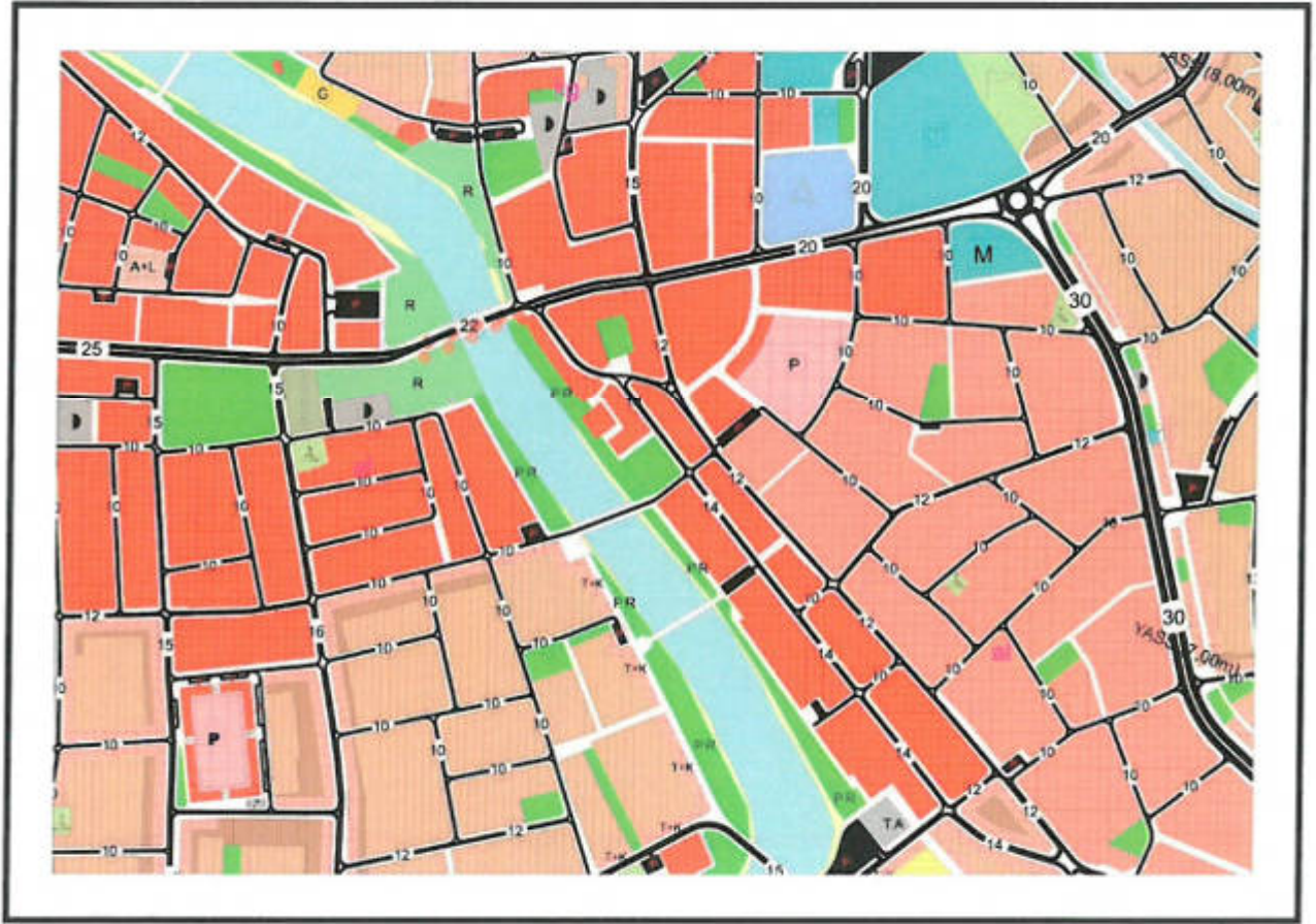
Şekil 2: Meri 1/5000 Ölçekli Nazım İmar Planı

Onaylı nazım imar planında plan değişikliğine konu 232 ada 17 park alanı, yol, park ve rekreasyon alanı olarak planlanmıştır.