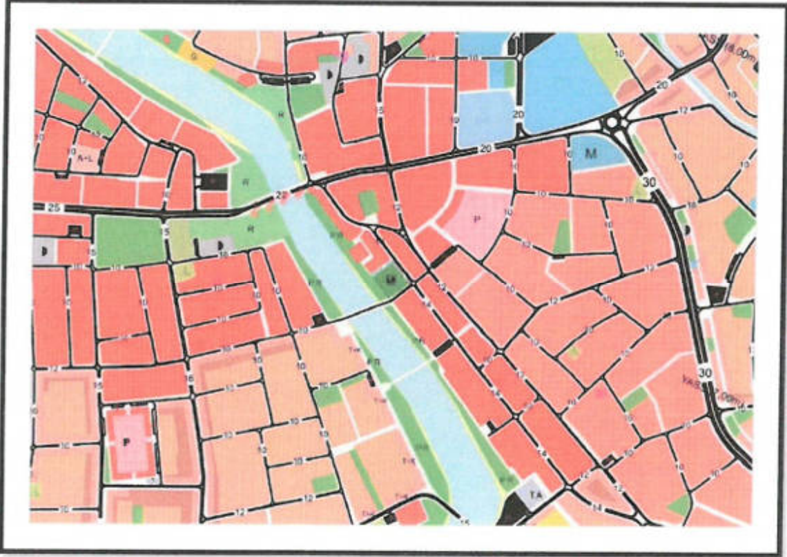
Şekil 3: Öneri 1/5000 Ölçekli Nazım İmar Planı Değişikliği

ERKAN DEMİRCİ Şehir ve Bölge Plancısı (YTÜ) Kahraman Mah. Hayatlı Hıncın Çay. Duvuz İşh. No: 3 / 110 ALAN / Tel: 0242 551 01 36 e-mail: erduptentama@gmail.com Dış. No: 21097 Binyatın No: 0710482 Okul Sicil No: 1649 / Mülkiyet V.D. 134 895 651 68