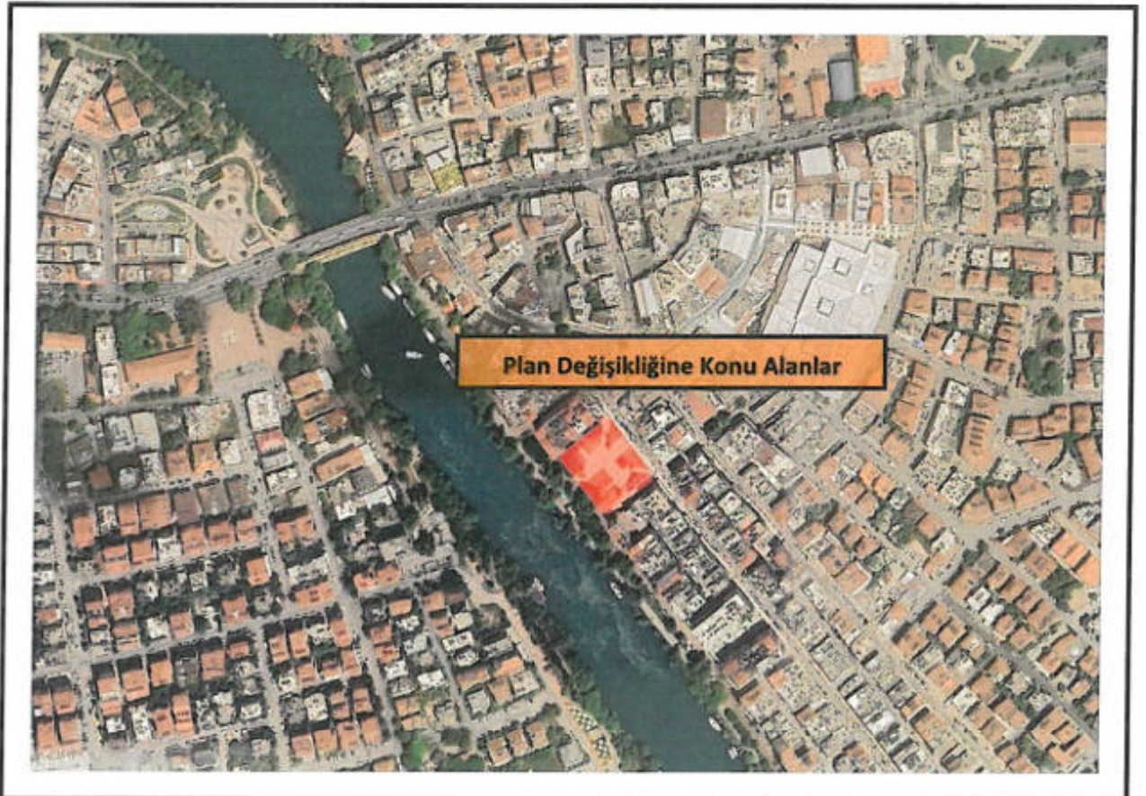
Şekil 1: Plan Değişikliğine Konu Alanın Uydu Görüntüsü

Alan konum olarak Pazarcı Mahallesi sınırları içerisinde, ilçe merkezinde ve Manavgat Irmağı kenarında yer almaktadır. Planlamaya konu alanın yakın çevresinde, ticaret alanları ile park ve rekreasyon alanı bulunmaktadır.