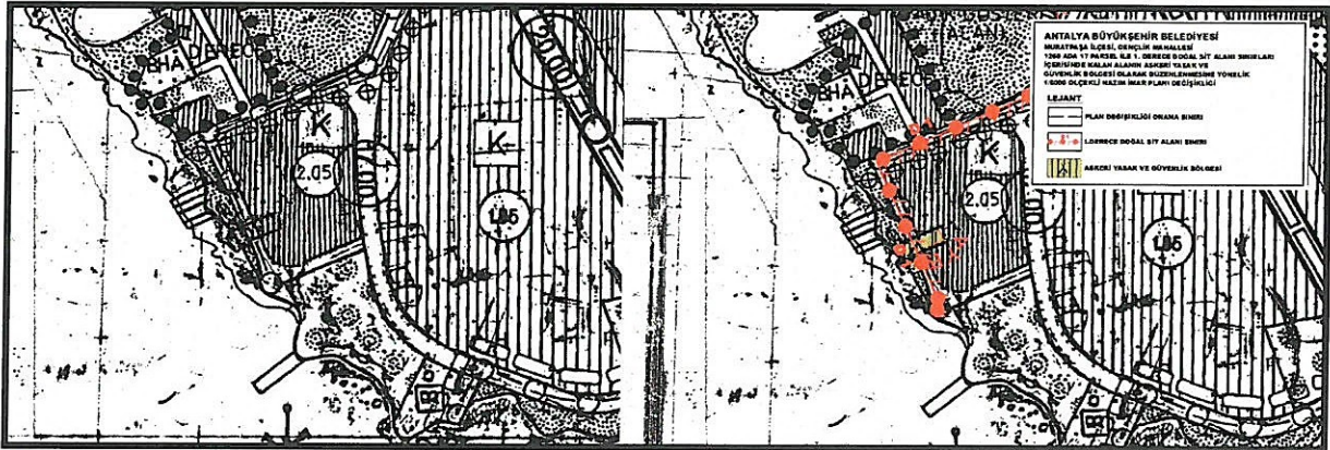
Şekil 3. 1/5000 ölçekli Nazım İmar Planı Mevcut-Öneri Durumu

Hazırlanan 1/5000 ölçekli Nazım İmar Planı değişikliği ile; mevcut durumda 2.05 yapılaşma koşullarına sahip Konut Alanı olarak planlı bulunan 1260 ada 17 parsel ile parselin güney batısındaki 1. Derece Doğal Sit Alanı sınırı içerisinde yer alan koordinatları ilgili yazı ekinde tarafımıza iletilen Park ve Yeşil Alan ve bu iki alan arasındaki yaya yolu olarak planlı bulunan alanın, Askeri Güvenlik Bölgesi olarak onaylanması sebebiyle ilgili yazı ekinde tarafımıza iletilen koordinatlarda belirtilen sınırlar dâhilinde "Askeri Yasak ve Güvenlik Bölgesi" olarak planlara işlenmesi amaçlanmıştır.