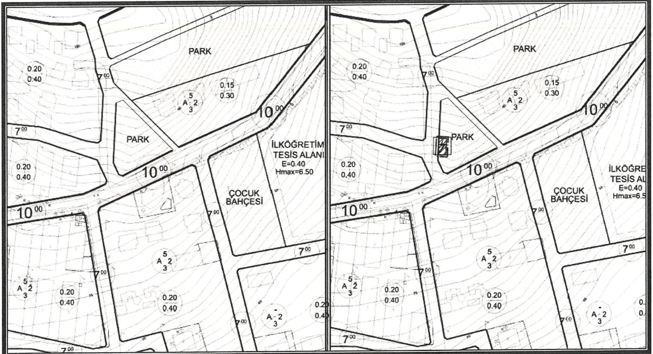
Şekil 3. Mevcut 1/1000 ölçekli Uygulama İmar Planı

Planlama çalışması yapılan alanda Enerji Piyasası Düzenleme Kurumundan Kamu yararı kararı ve Enerji Tabii Kaynaklar Bakanlığında olur alınabilmesi ayrıca bu olur ile TEDAŞ Genel Müdürlüğünün kamulaştırmaya başlaması için imar planlarında trafo alanlarının işlenmiş olması gerekliliğinden Akdeniz Elektrik Dağıtım A.Ş.'nin talebi üzerine 1815 adanın kuzeyinde ki park alanı içerisinde 50 m 2 büyüklüğünde trafo alanı planlanması amacı ile 1/1000 ölçekli Uygulama İmar Planı Değişikliği hazırlanmıştır.