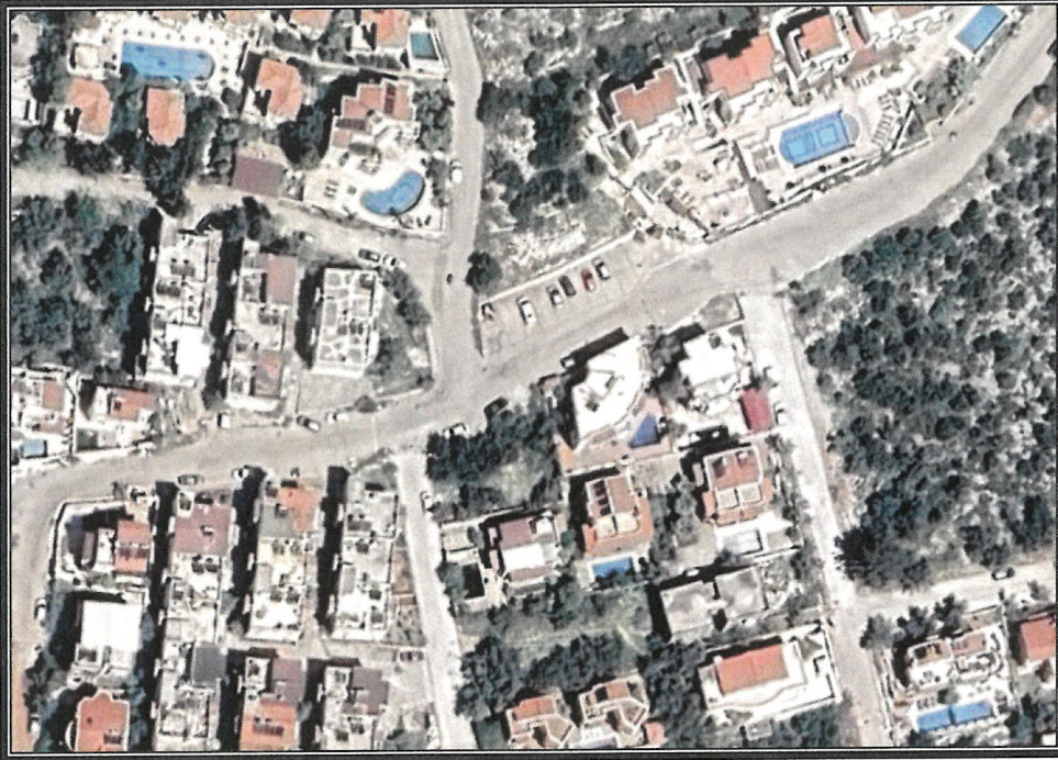
Şekil 1. Hava Fotoğrafı

Antalya İli, Kaş İlçesi, Kalkan mahallesi sınırları içerisinde P22B 24D 1C paftasında 1815 parselin kuzeyinde bulunan park alanı içerisinde trafo alanı planlanmasına yönelik 1/1000 ölçekli Uygulama İmar Planı Değişikliği hazırlanmıştır.