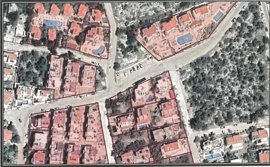
Şekil 2. Parselasyon Planı