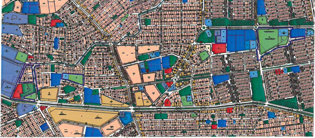
Resim 4: Öneri 1/1000 Ölçekli Uygulama İmar Planı Revizyonu Taslağı

Buna göre 1/1000 ölçekli uygulama imar planında istenilen değişikliğe uygun olacak biçimde bir revizyon taslağı hazırlanmıştır (Bkz: Resim 4).