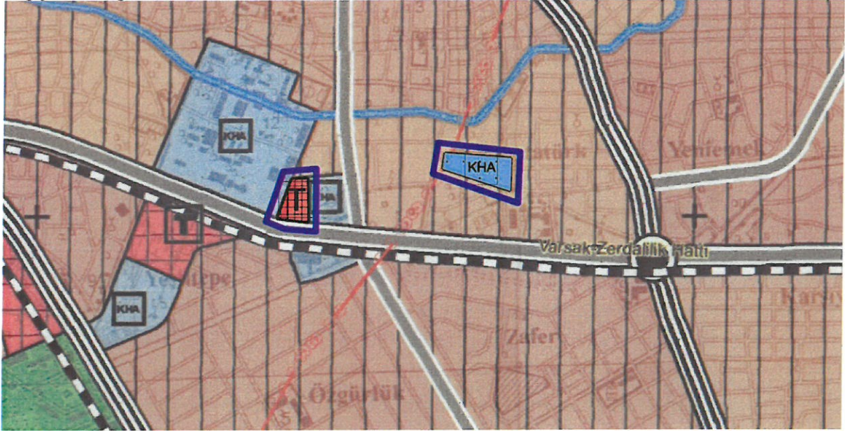
Resim 5: Öneri 1/25000 Ölçekli Nazım İmar Planı

Ancak 1/1000 ölçekli uygulama imar planında istenilen değişikliklerin yapılabilmesi için öncelikle 1/25000 ölçekli nazım imar planının ve sonrasında 1/5000 ölçekli nazım imar planının değiştirilmesi gerekmektedir.