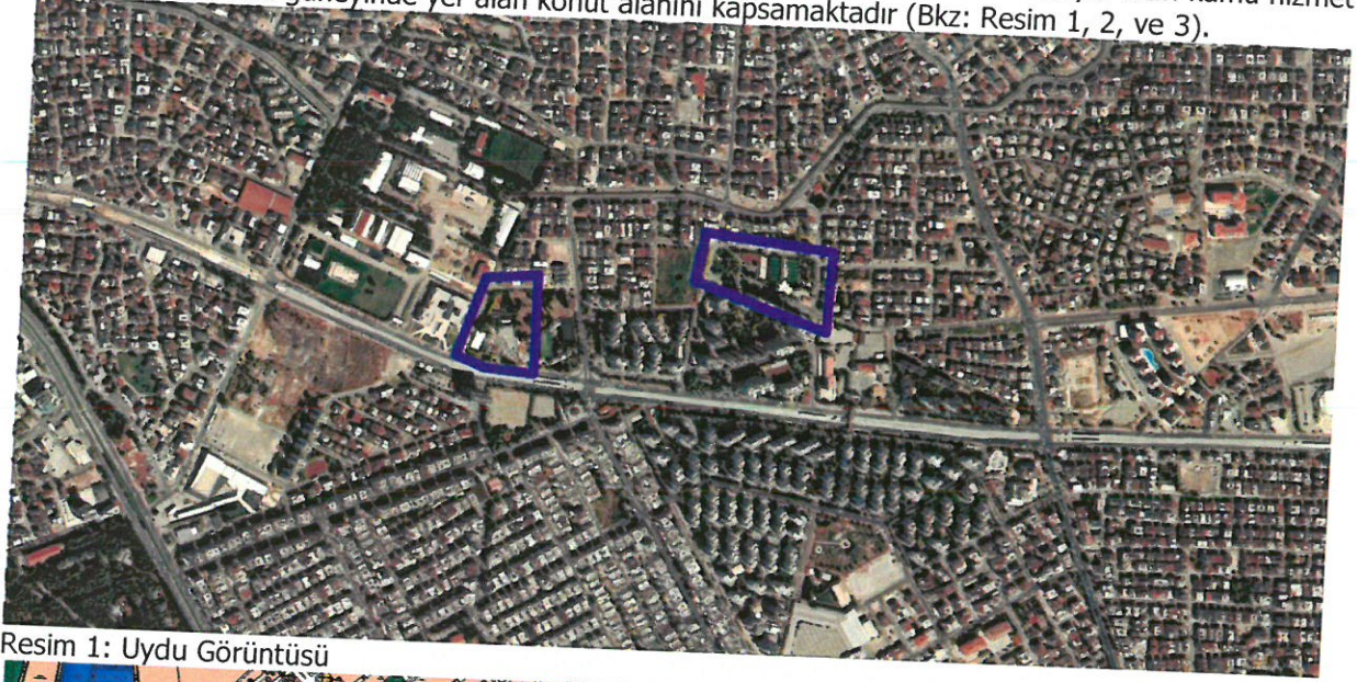
Resim 1: Uydu Görüntüsü

Plan revizyonu; Antalya İli, Kepez İlçesi, Atatürk Mahallesi, 11141 adada yer alan kamu hizmet alanı ile 10856 ada güneyinde yer alan konut alanını kapsamaktadır (Bkz: Resim 1, 2, ve 3).