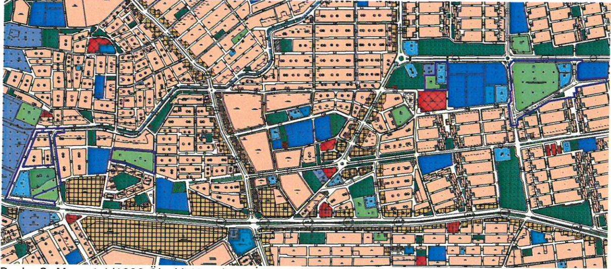
Resim 2: Mevcut 1/1000 Ölçekli Uygulama İmar Planı