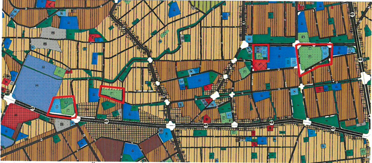
Resim 3: Mevcut 1/5000 Ölçekli Nazım İmar Planı