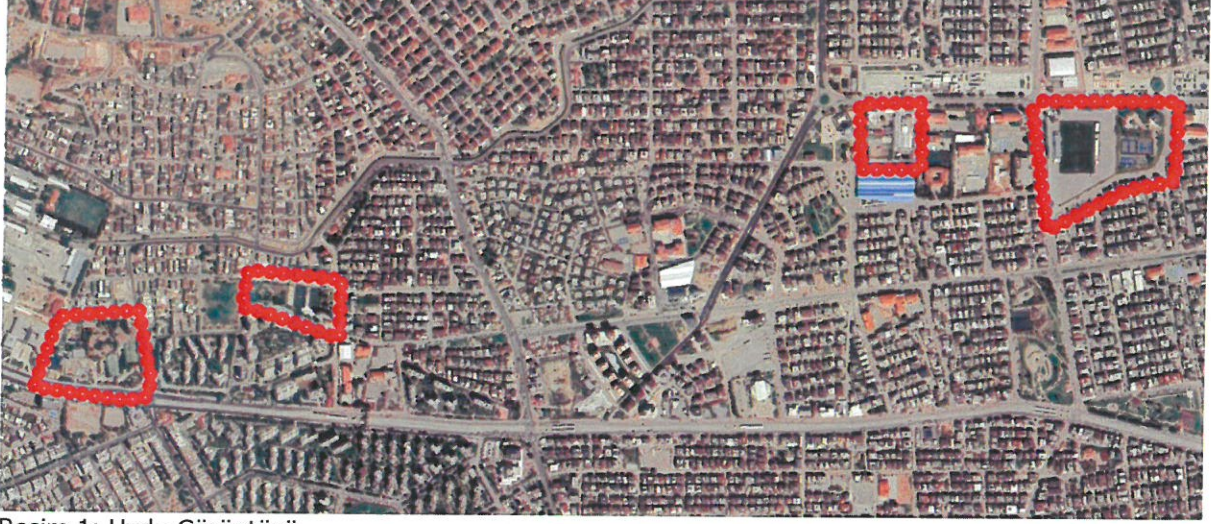
Resim 1: Uydu Görüntüsü

Plan revizyonu; Antalya İli, Kepez İlçesi, Atatürk Mahallesi ve Yeni Mahallede yer alan Sosyal Tesis, Mezarlık, Spor, Otopark, Kültürel Tesis ile Park alanlarını kapsamaktadır (Bkz: Resim 1, 2, ve 3).