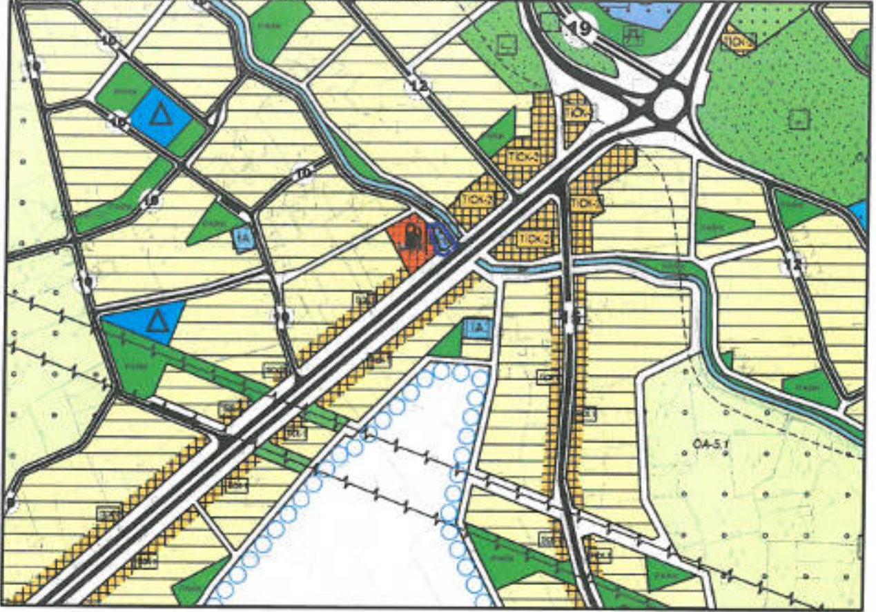
Sekil 3: Öneri 1/5000 Ölçekli Nazım İmar Planı Değişikliği