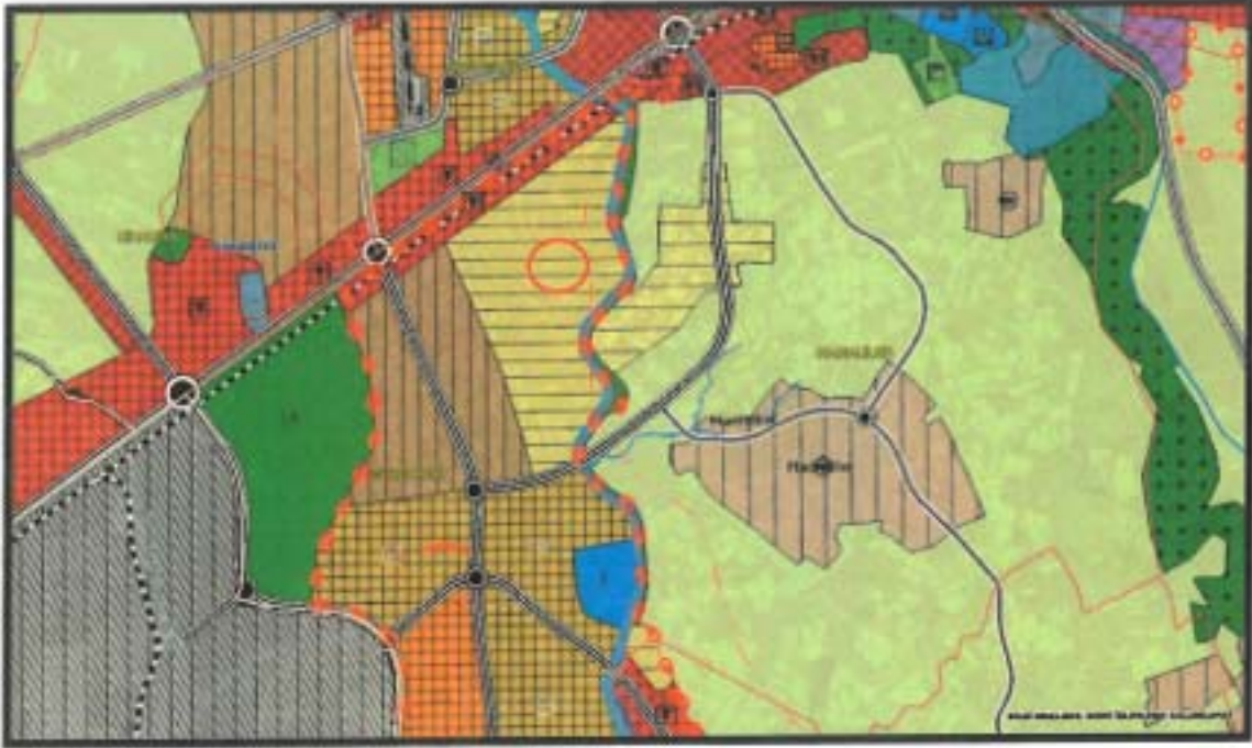
Şekil 2. 1/25000 ölçekli Nazım İmar Planı

Plan Revizyonuna konu alan yürürlükte bulunan 1/25000 ölçekli Nazım İmar Planında "Gelişme Konut Alanı" olarak planlıdır (Şekil 2).