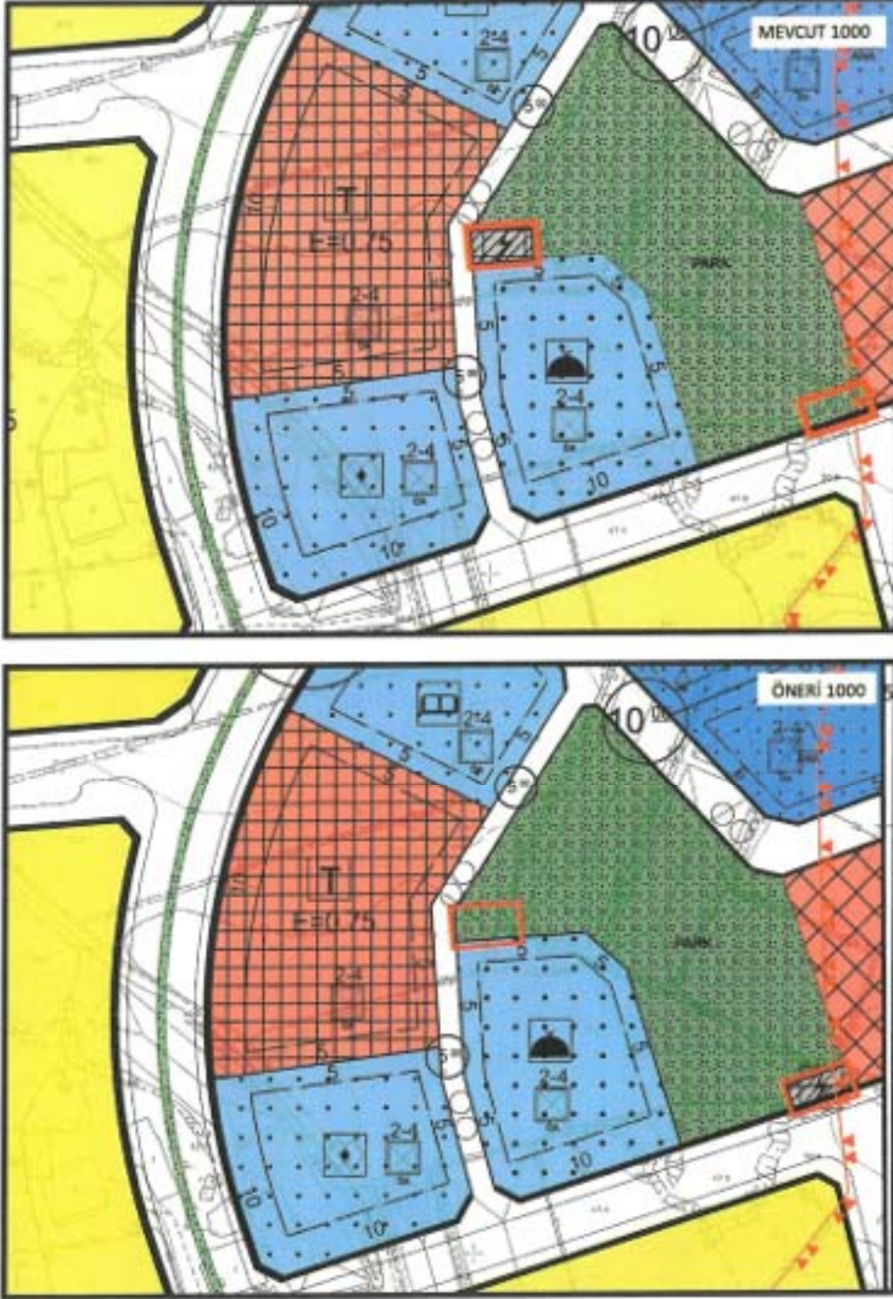
Şekil 4. 1/1000 Ölçekli Uygulama İmar Planı Revizyonu.

Üst ölçekli plan kararları doğrultusunda 1/1000 ölçekli uygulama imar planı revizyonu hazırlanmış olup 1/1000 ölçekli uygulama imar planı revizyonu ile 14980 ada 3 parselin kuzeyinde yer alan 111 m 2 lik trafo alanı; Akdeniz Elektrik Dağıtım A.Ş.'nin 05.02.2024 tarih ve 324473 sayılı yazısı ekinde belirtildiği üzere 14980 ada 5 parsel batısında yer alan park alanına 105 m 2 olacak şekilde taşınmıştır.