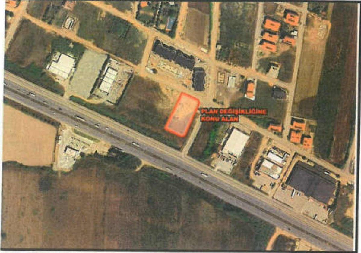
Şekil 1: Planlamaya Konu Alanın Uydu Görüntüsü

Söz konusu planlama alanı "Ilica (Manavgat-Antalya) D-400 Karayolu Kuzeyi Revizyon Nazım İmar Planı" sınırları dâhilinde, 1/5000 ölçekli O26B18C numaralı nazım imar planı paftası içerisinde yer alan 547 ada 3 parsel ile 418 ada 1 parselin arasında kalmaktadır. Plan değişikliğine konu alanın toplam büyüklüğü yaklaşık 2115,54 m 2 'dir.