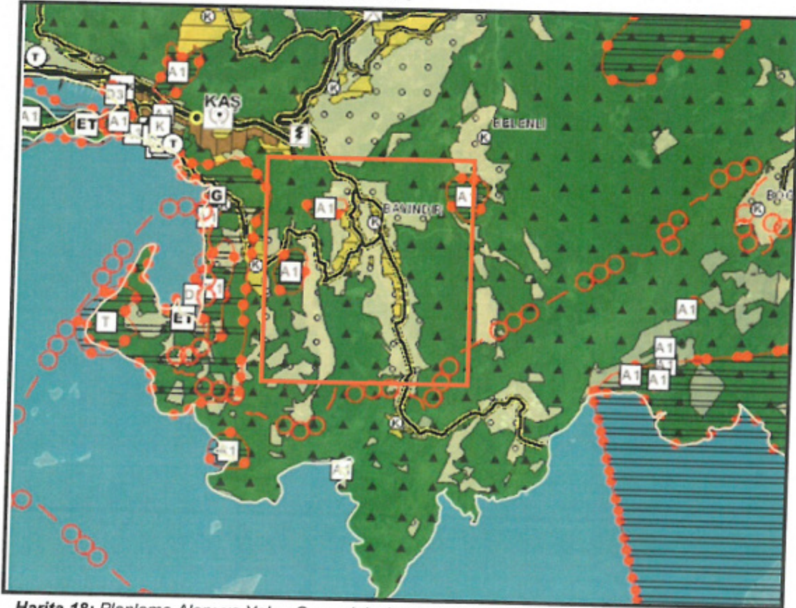
Harita 18: Planlama Alanı ve Yakın Çevresinin Antalya-Burdur-Isparta Planlama Bölgesi 1/100.000 Ölçekli Çevre Düzeni Planındaki Yeri