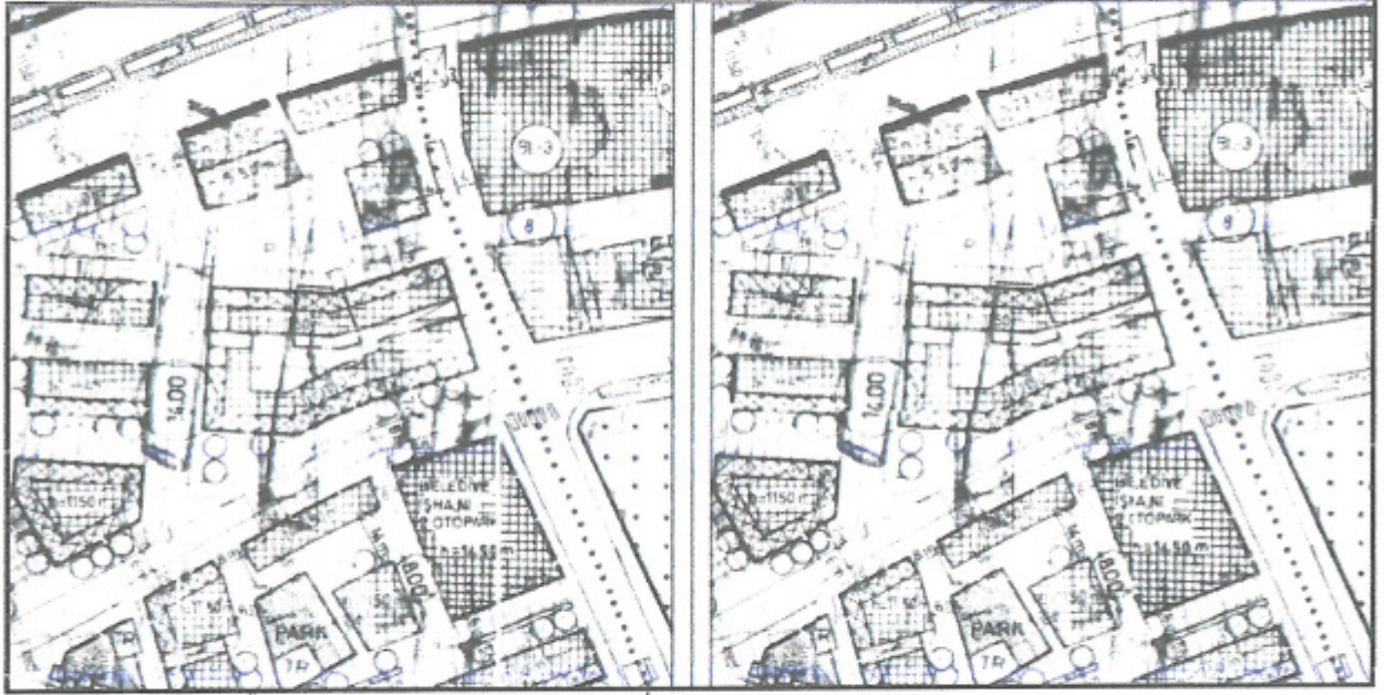
Plan 1: Mevcut ve Öneri 1/1000 ölçekli Uygulama İmar Planı Değişikliği