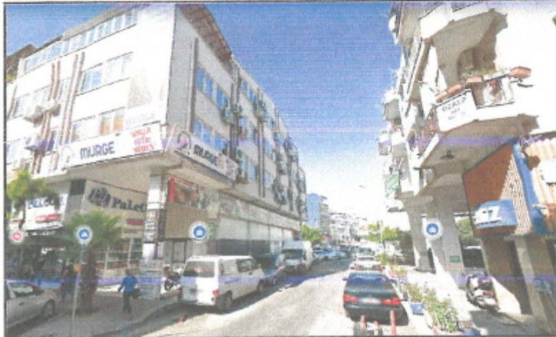
Resim 2: Planlama Alanının Mevcut Durumu

Planlama alanı, 1/1000 ölçekli Uygulama İmar Planı'nda "Ticaret Alanı" planlama kararı bulunmaktadır. Mevcutta da yer alan ticari yapı geçmiş dönemler yönetmelik ve plan hükümlerine göre inşa edilmiştir.