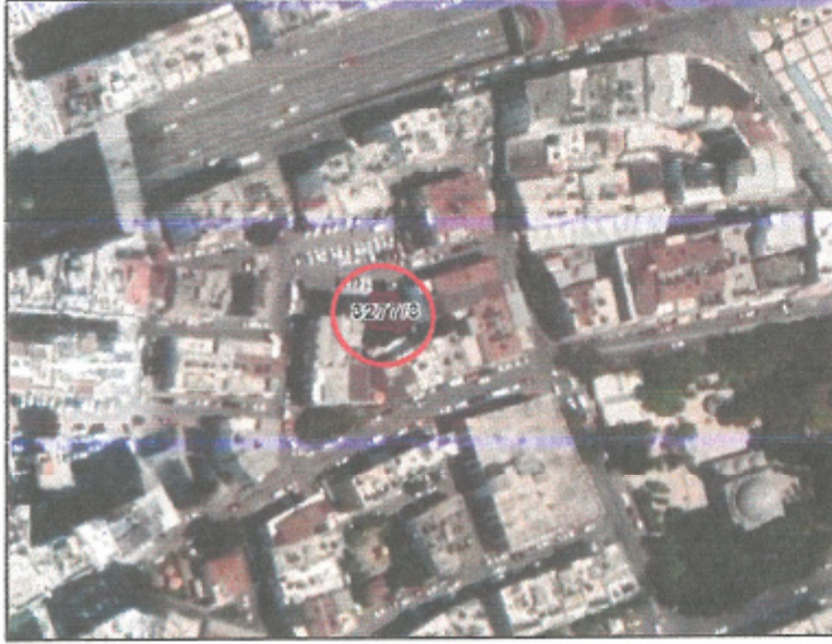
Resim 1: Uydu Fotoğrafi

Antalya ili , ( Büyükşehir ) Muratpaşa ilçesi, Kızılsaray Mahallesi sınırları içerisinde tapunun 3277 ada 3 parsel numarasında kayıtlı, 130 m 2 büyüklüğündeki taşınmazı konu alan, 20K-3A nolu İmar Planı paftasında yer alan 1/1000 ölçekli Uygulama İmar Planı Değişikliği hazırlanmıştır.