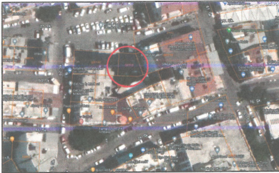
Harita 1: Parselasyon Durumu

Antalya ili, Muratpaşa ilçesi, Kızılsaray Mahallesi, 3277 ada 3 parselin parselasyon durumunu ve güncel uydu görüntüsünü gösteren harita aşağıdadır.