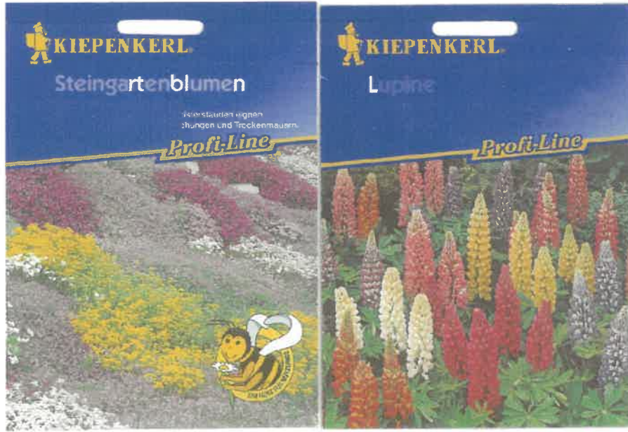
Mevsimlik Çiçek Tohumu Numuneleri

Gartneriet Lundegaard ApS Espestok 54 5210 Odense NV Tlf.: +45 2122 5488 E-mail: 488@50488.dk www.50488.dk