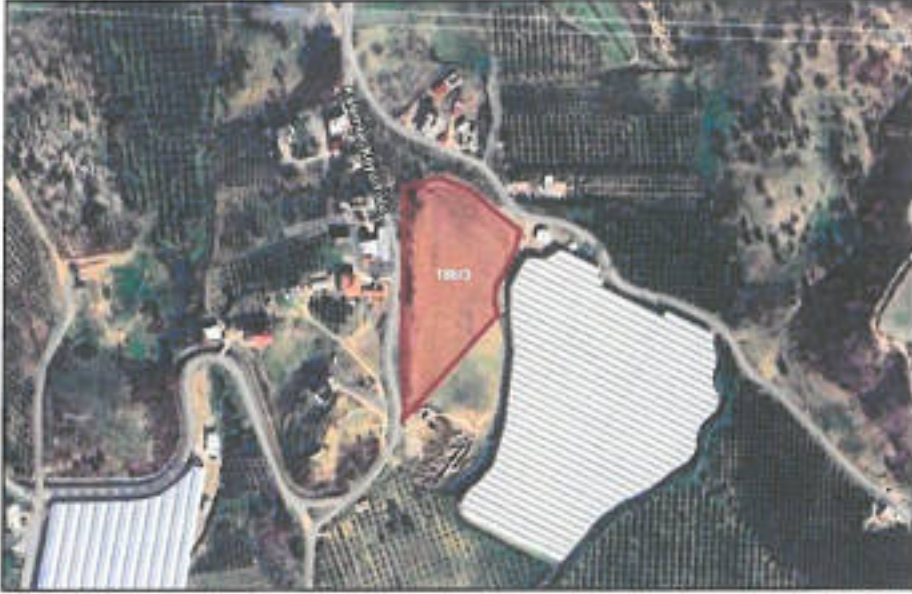
Şekil 1. Planlama konusu alanı ve yakın çevresini gösterir uydu görüntüsü

1/5.000 ölçekli nazım imar planı teklifi Antalya ili, Manavgat ilçesi, Kalemler Mahallesi sınırları içerisinde, O26-b-13-d no.lu 1/5.000 ölçekli hâlihazır paftasında kalan, 16.357,34 m 2 yüz ölçümlü 186 ada 3 parsel no.lu taşınmazın 9.495,10 m 2 'lik kısmını kapsamaktadır. Antalya Valiliği'nin (İl İdare Kurulu) 31.08.2004 tarih ve 4/2498 sayılı kararı ile belirlenen köy yerleşik alanı ve civarında kalan taşınmaz, Antalya-Alanya D-400 (Akdeniz Sahil Yolu) Karayolu'nun yaklaşık 4 km kuzeyindedir.