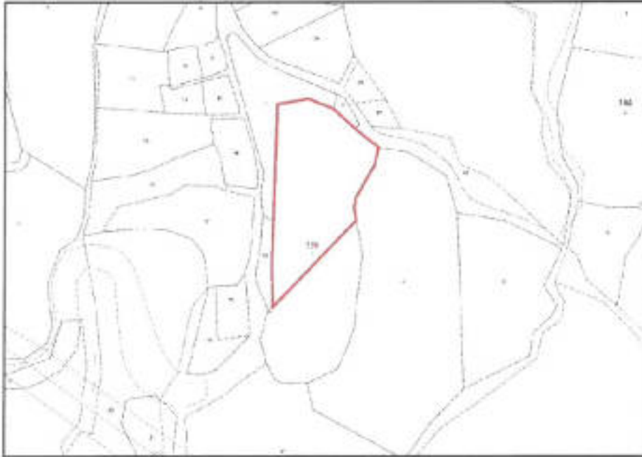
Şekil 2. Taşınmaz ve çevresinin mülkiyet sınırlarını gösterir kroki

Nazım imar planı teklifine konu 186 ada 3 parsel no.lu taşınmaz tapuda zeytinlik vasfı ile kayıtlıdır.