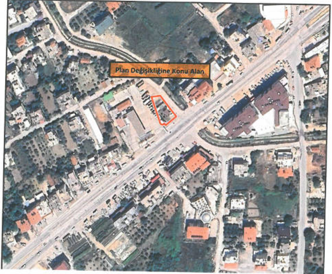
Şekil 1: Plan Değişikliğine Konu Alanın Uydu Görüntüsü

Alan konum olarak, Taşağıl Mahallesi yerleşim alanı içerisinde, D-687 Karayoluna cepheli konumda kalmaktadır. Planlamaya konu alanların yakın çevresinde ticaret+ konut alanları ve konut yerleşme alanları bulunmaktadır.