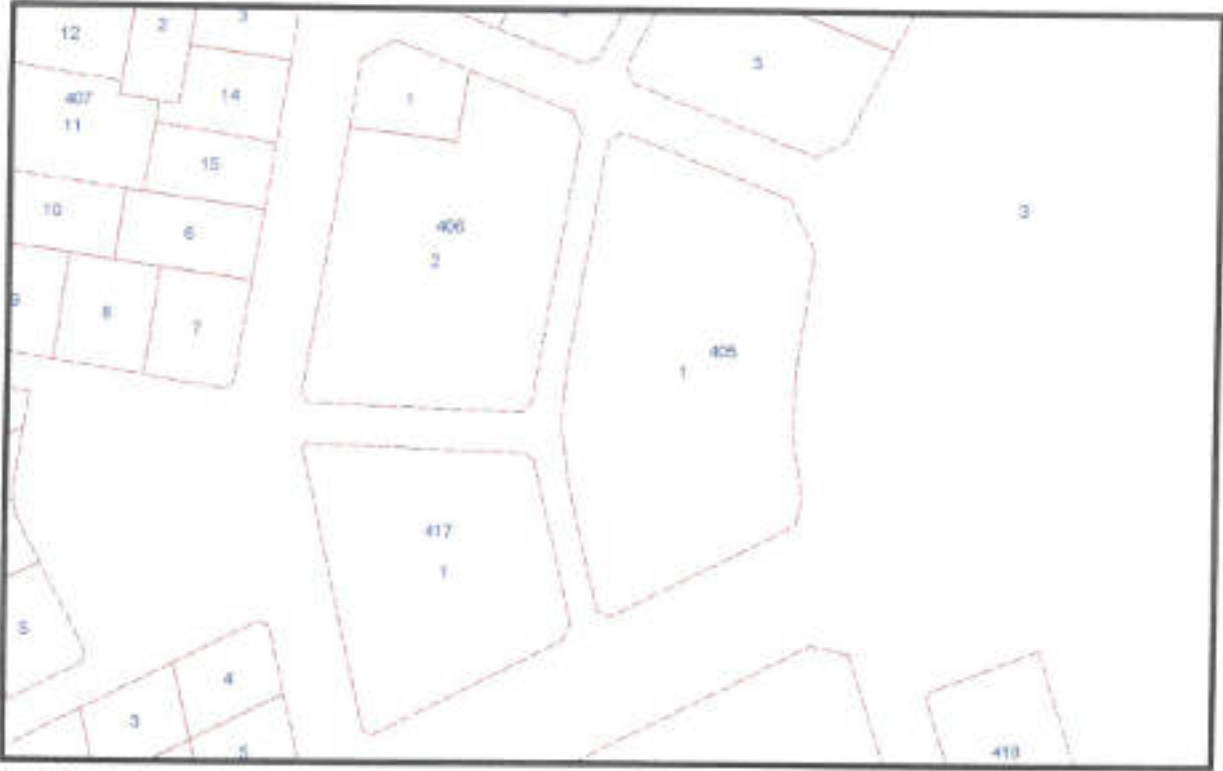
Şekil 3: Kadastral Durum

Plan değişikliğine konu parseller üzerinde herhangi bir yapı bulunmamaktadır. Planlama alanında imar uygulaması tamamlanmış durumdadır. Alana ilişkin kadastral durum aşağıdaki haritada verilmiştir.