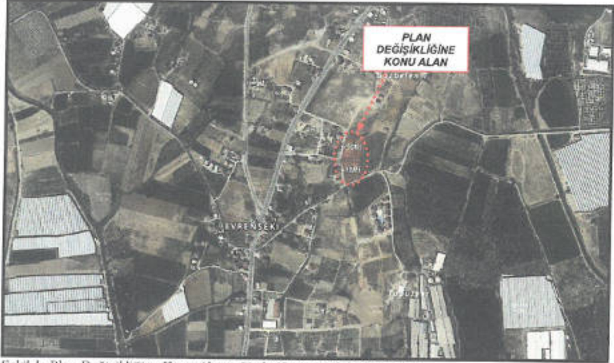
Şekil 1: Plan Değişikliğine Konu Alanın Uydu Haritasındaki Görünümü

Plan değişikliğine konu alan; Antalya İli, Manavgat İlçesi, Evrenseki Mahallesi, 1/1000 ölçekli O-26-B-12-C-3-C no.lu imar paftasında yer alan 417 ada 1 parsel ile 406 ada 2 parsel no.lu taşınmazın bir kısmını kapsamaktadır. Tapu kaydına göre 406 ada 2 no.lu parsel 4149 m 2 , 417 ada 1 parsel 3336 m 2 'dir. Tadilatla konu alan büyüklüğü ise yaklaşık 1440 m 2 'dir. Söz konusu parsellerin D-400 Karayolu'na uzaklığı yaklaşık 3 km olup taşınmazlara ulaşım Evrenseki yerleşim merkezinin ana ulaşım arterine bağlanan asfalt yol üzerinden sağlanmaktadır.