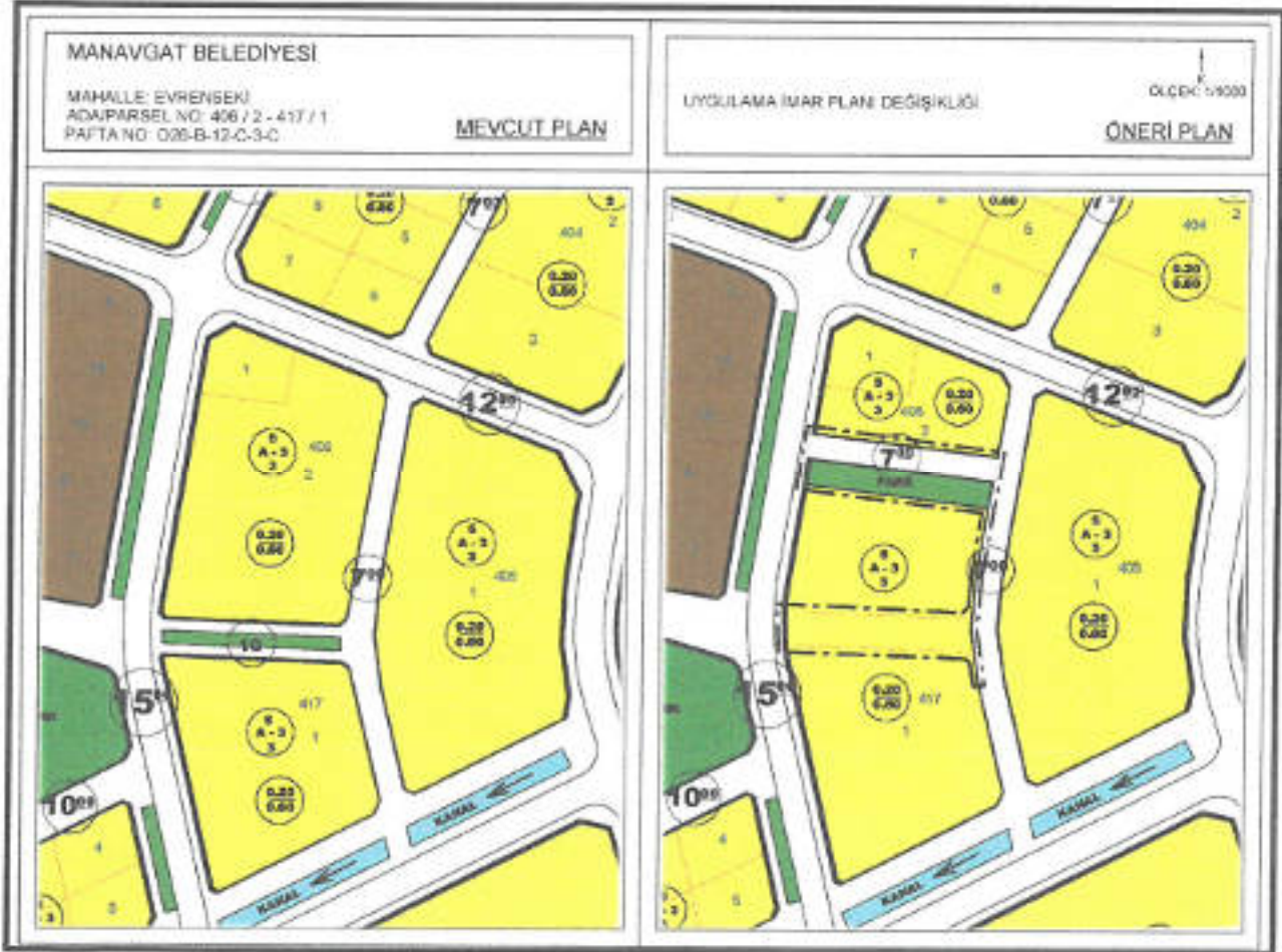
Şekil 4: Mevcut-Öneri Uygulama İmar Planı