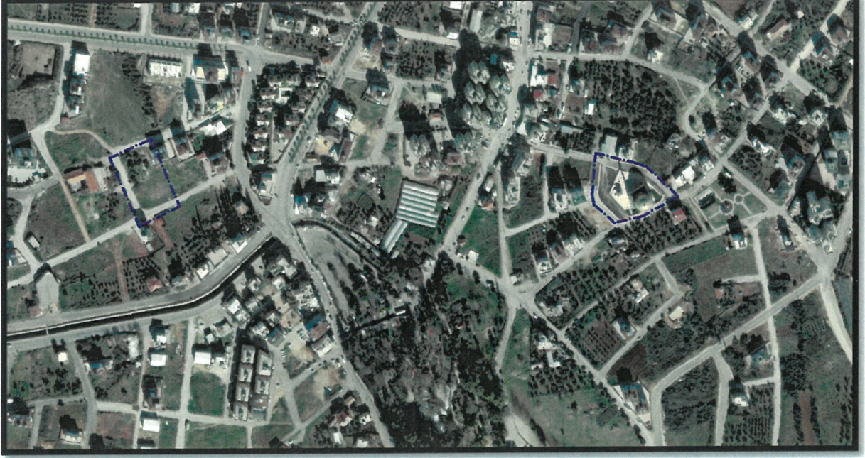
Resim 1: Uydu Görüntüsü

Plan değişikliğine konu alan; Antalya ili, Kepez ilçesi, Şelale Mahallesi, O25A-05C-1D No.lu 1/1000 ölçekli Uygulama İmar Planı paftasında yer alan, 29527 adada bulunan Cami ve Park Alanı ile Ayanoğlu Mahallesi, O25A-05D-2C No.lu 1/1000 ölçekli Uygulama İmar Planı paftasında yer alan 624 ada batısı Otopark ve Park Alanını kapsamaktadır. (Bkz: Resim 1)