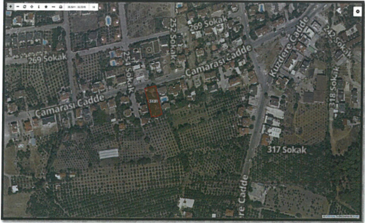
Şekil 1: Uydu görüntüsü

Plan deęişikliğine konu 430 ada 1, 2, 3, 4, 5, 6, 7, 8, 9 ve 10 parsel numaralı taşınmazlar Antalya ili Kemer Belediye sınırları içerisinde yer alan Arslanbucak Mahallesinde yer almakta olup, bahse konu alana ilişkin imar planları Kemer Belediye Meclisince 24.01.2014 tarihinde onaylanmıştır. Plan deęişikliğine konu taşınmazlar mevcut statüsü ile planlı taşınmaz olup, taşınmazlar il ve ilçe belediye meclisince onama yetki alanı içerisinde kalmaktadır. Ayrıca, 430 ada 3 parselin mülkiyeti Kemer Belediye Başkanlığına aittir.