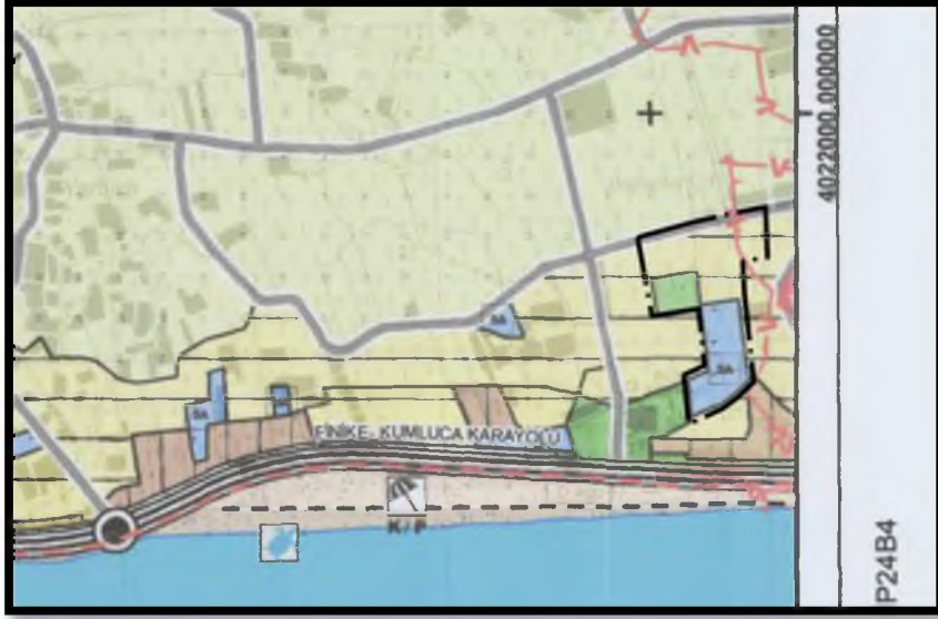
Görsel 2: Mevcut Nazım İmar Planı

Antalya İli Finike İlçesi Hasyurt Mahallesi 186 ada 171 parsel ve çevresinde Finike Belediyesinin talepleri doğrultusunda mevcut imar planında yer alan Sosyal Alt Yapı Alanı, Park ve Yeşil Alan (Alt ölçekli Nazım İmar planında Park ve Eğitim Alanları) çalışma alanının kuzeyine taşınmıştır. Çalışma Alanının güneyinde bulunan Sosyal Alt Yapı Alanları Eğitim Alanları olarak değişikliği yapılmıştır. Yapılan plan değişikliği sonucu donatı alanlarında azalma olmamıştır.