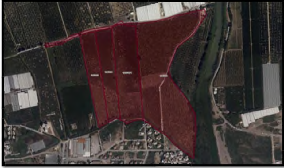
Görsel 2: Planlama Alanı Uydu Görüntüsü

Antalya İli Finike İlçesi Hasyurt Mahallesi 186 ada 171 parsel ve çevresini kapsamaktadır. Çalışma alanı P24-A-3 imar paftalarında olup, 1 adet halihazırda yer almaktadır. Planlama alanı yaklaşık olarak 14.5 Ha (145.063 m 2 ) dır.