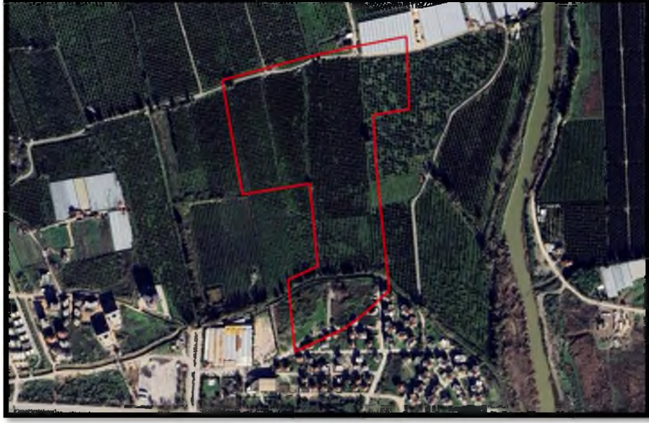
Görsel 1: Planlama Alanı Uydu Görüntüsü