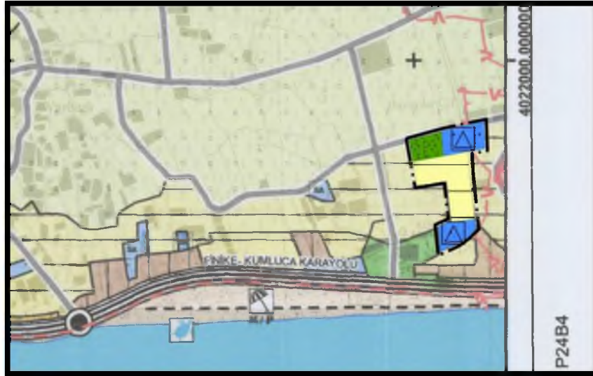
Görsel 2: Öneri Nazım İmar Planı