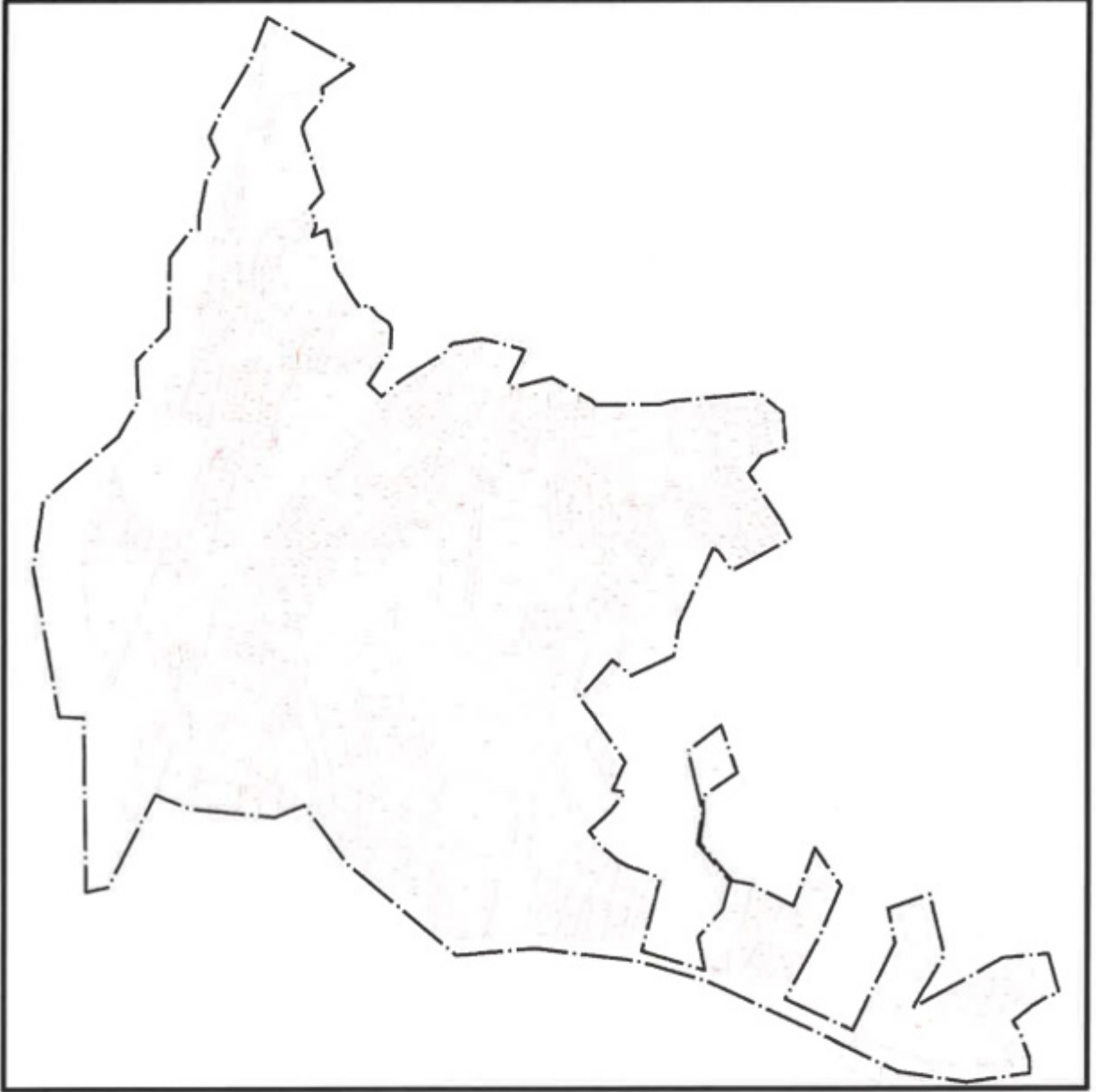
Şekil.2. Planlamaya Konu Taşınmazların ve Çevresinin Mülkiyet Sınırlarını Gösterir Kroki