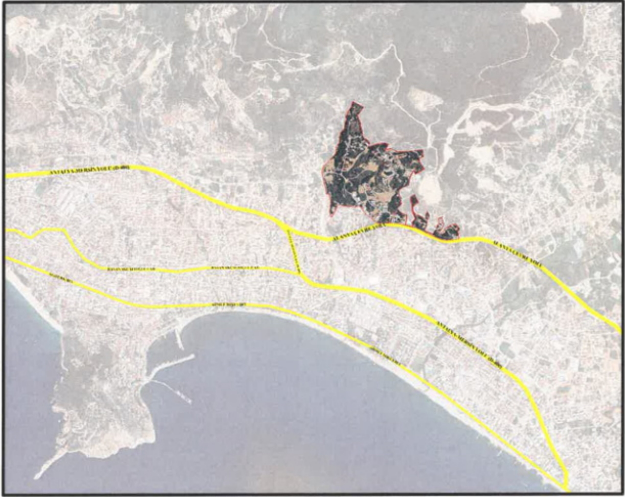
Şekil.1.Planlama Alanının Uydu Görüntüsü

Uygulama imar planı deęişikliği teklifine konu alan; Antalya ili Alanya ilçesi Cikcilli Mahallesi sınırları içerisinde yer almakta olup yaklaşık 73 hektarlık bir alanı kapsamaktadır. Uygulama imar planı deęişikliği teklifi O28D16D2C, O28D16C1D, O28D16C4A, O28D16C4B, O28D16C4C, O28D16C4D, O28D16D3B, O28D16D3C ve O28D21B1B pafta sınırları içerisinde bulunmakta olup Alanya Çevre Yolu ile Antalya-Mersin Yolu (D-400)'nun kuzeyinde, Alanya merkezin kuzeydoğusunda yer almaktadır (Şekil-1).