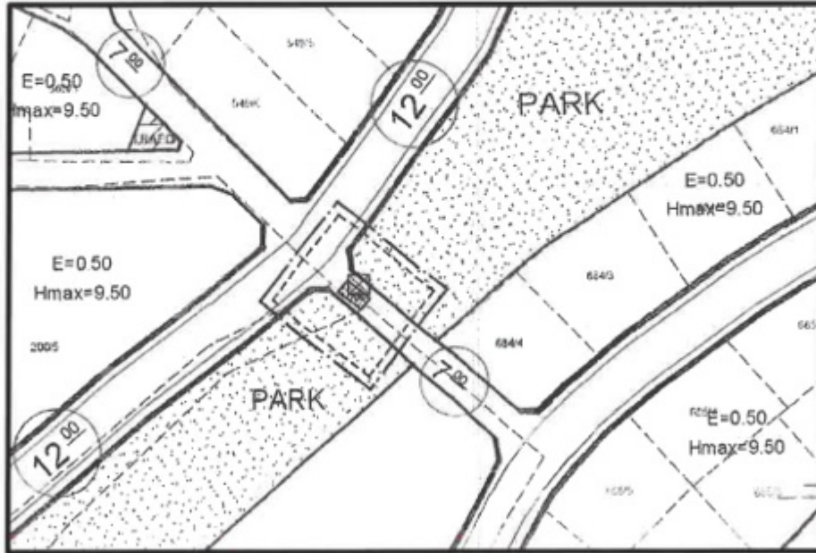
Şekil.7. Alanya Belediye Meclisi'nin 06.08.2020 Tarih Ve 198, Antalya Büyükşehir Belediye Meclisi'nin 12.10.2020 Tarih Ve 601 Sayılı Kararları İle Onaylanan 1/1.000 Ölçekli Uygulama İmar Planı Değişikliği

Ayrıca plan değişikliği sınırları içerisinde, 199 ada 1 ve 200 ada 5 no.lu parsellerin kuzeyinde yer alan Antalya Kültür Varlıklarını Koruma Bölge Kurulu'nun 26.04.2019 tarih ve 9264 sayılı kararı ile tescillenen köprünün koruma alanına ilişkin hazırlanan Uygulama İmar Planı Değişikliği, Antalya Kültür Varlıklarını Koruma Bölge Kurulu'nun 13.05.2020 tarih ve 10732 sayılı kararı ile uygun bulunmuş, Alanya Belediye Meclisi'nin 06.08.2020 tarih ve 198, Antalya Büyükşehir Belediye Meclisi'nin 12.10.2020 tarih ve 601 sayılı kararları ile onaylanmıştır. Daha sonra bölgede yapılan kat artışına ilişkin imar planı değişikliğinde koruma alanı sınırı imar planına sehven işlenmemiş olup koruma alanı sınırının da tekrardan imar planına işlenmesi amaçlanmaktadır.