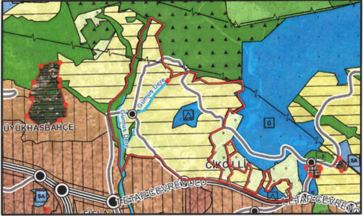
Şekil.4. Planlamaya Konu Alanın Meri 1/25.000 Ölçekli Nazım İmar Planı'ndaki Yeri

Söz konusu değişikliğe konu taşınmazların meri 1/5000 ölçekli nazım imar planında belediye hizmet alanı, eğitim alanı, gelişme konut alanı, ibadet alanı, kültürel tesis alanı ve park alanı olarak planlanmıştır (Şekil.5).